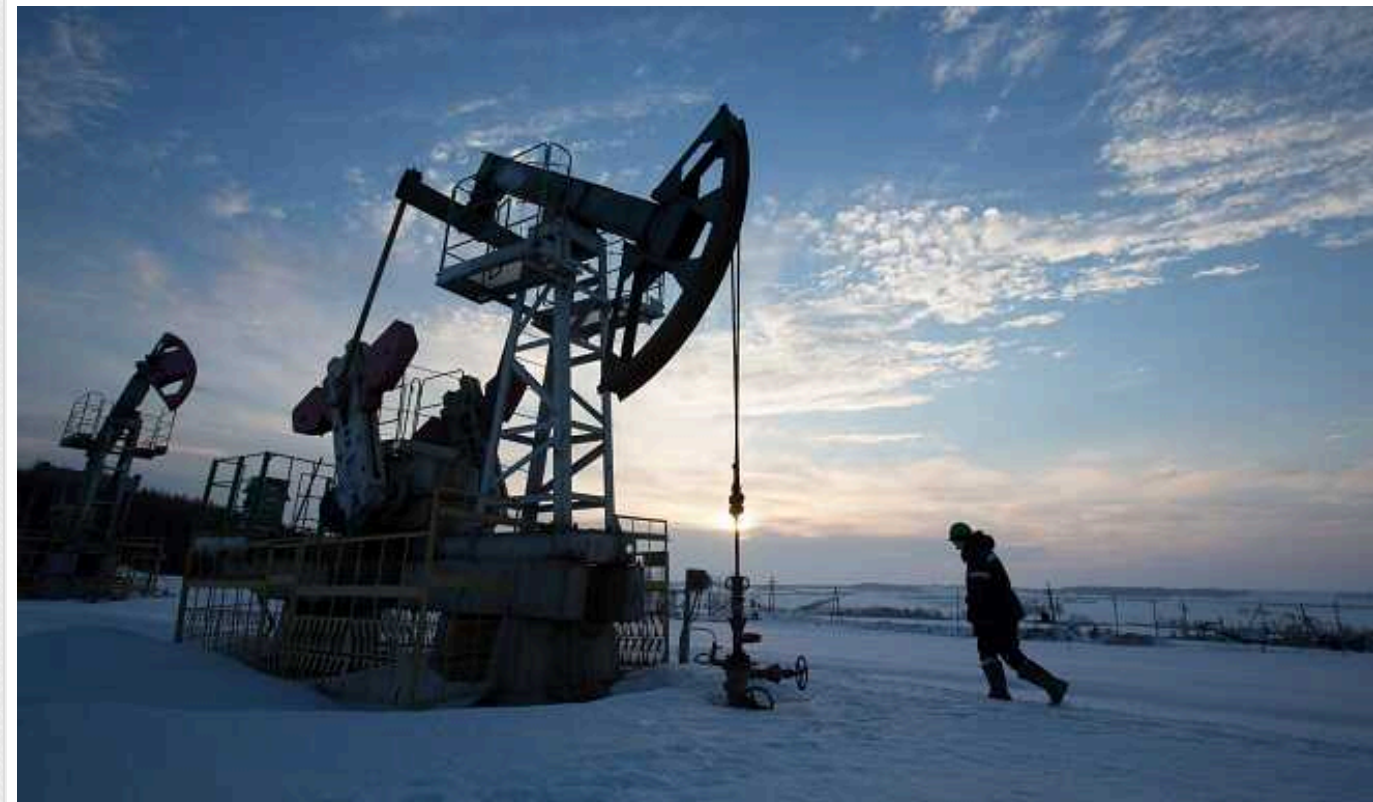
ЗМІ розкрили лазівки та схеми поставок російської нафти на Захід в обхід санкцій

Російська нафта, попри санкції, продовжує надходити на ринок Великої Британії. Щоправда, вже у вигляді нафтопродуктів. Постачання ведуться через лазівку з нафтопереробними заводами, що зрештою підвищує глобальний попит на російську нафту. Водночас РФ також не припиняє використовувати т.зв. тіньовий флот танкерів, який тепер "переїжджає" під прапор Габону.