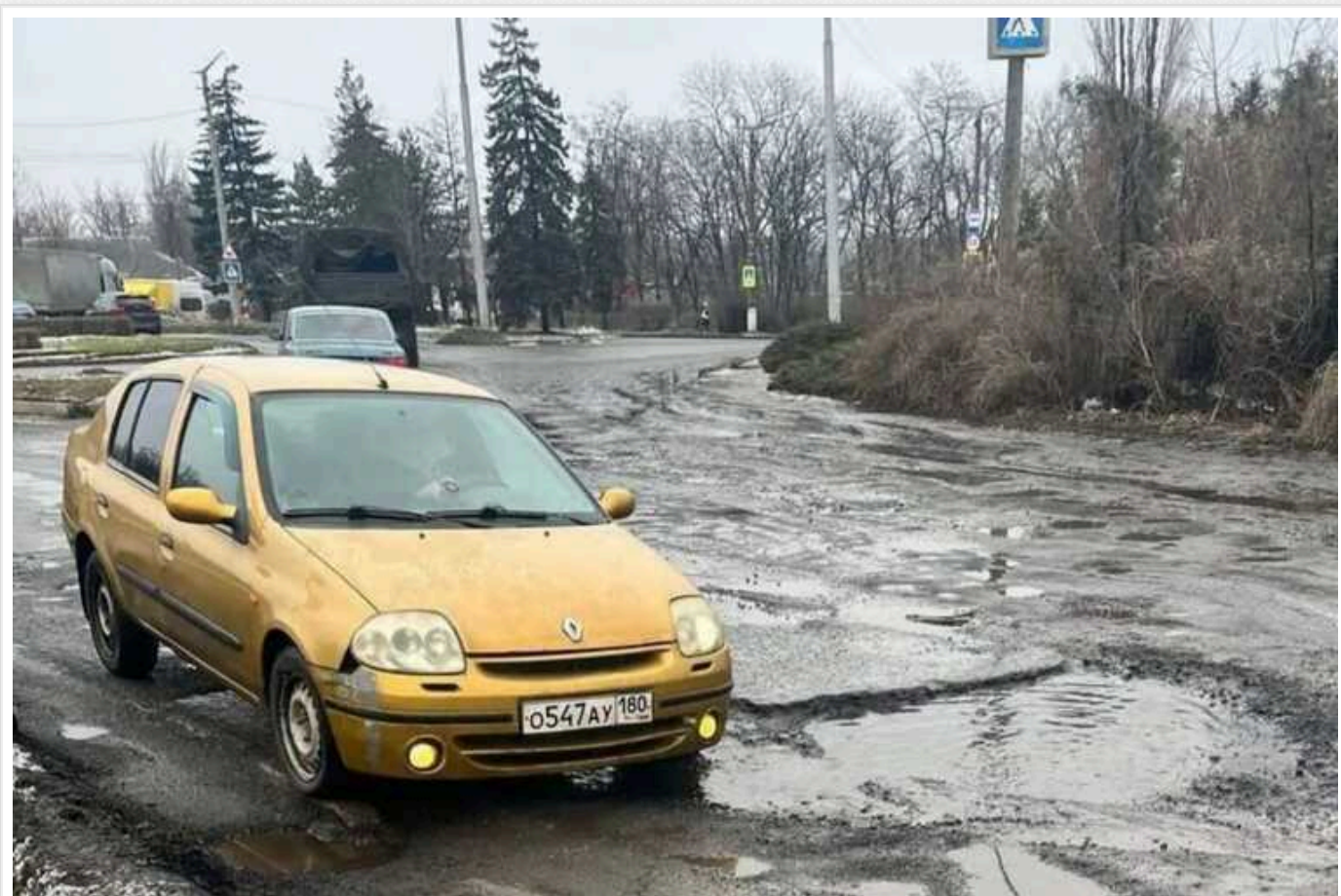
Що зараз відбувається в окупованому Донецьку: "Щури заповнили центр міста, спимо в шубах, води немає"

З красивого обласного центру з мільйонам троянд Донецьк перетворився на обширну "столицю ДНР". Роки окупації звели нанівещі усі зусилля та велічезну працю місцевих жителів, які трепетно любили своє місто. Сьогодні в усіх районах стихійні сміттєзвалища, велічезні проблеми з водопостачанням та опаленням. І незважаючи на заповнення окупантів, що після "офіційного приєднання до Росії обов'язково все налагодиться", це виявилось черговою казкою – ситуація погіршується з кожним днем.