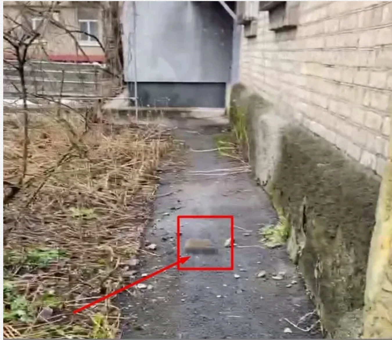
Фото та відео зі щурами розлучені донеччани викладають у соціальних мережах і скаржаться на відсутність реакції санепідстанції.

А у висотках центрального Ворошилівського району ще перед Новим роком розвісили оголошення, що буде припинено приборання прибудинкової території, а також "у зв'язку з неуклектованістю штату" не вивантажуватимуться сміттєпроводи. Комунальники також попередили мешканців, що у разі "порушень" у будинку заведуться щури. Але цих великих гризунів у Донецьку і так уже хоч греблю гати – вони буквально окупували підвали і, не болячись, пересуваються домітками та дворами, "перегризають все, що можливо".