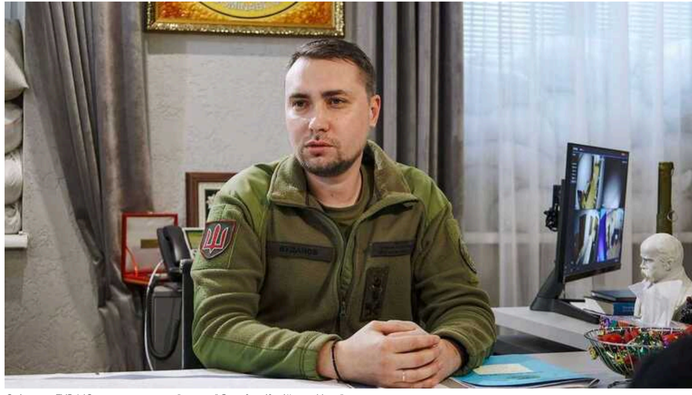
Очільник ГУР МО висловився про "втому" Заходу від війни в Україні

Очільник Головного управління розвідки Кирило Буданов наголосив, що в Україні триває війна, тому говорити про втрату "інтересу" Заходу недоцільно.