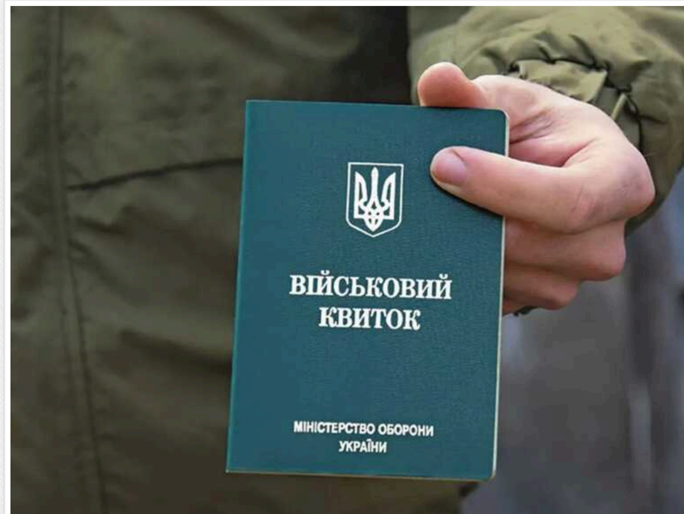
Оборонний комітет ВР підтримав законопроекти про продовження мобілізації та воєнного стану

Сьогодні, 6 лютого, комітет Верховної Ради з питань національної безпеки, оборони у розвідці підтримав президентські законопроекти (№10457 та №10456) щодо продовження в Україні строку дії воєнного стану та проведення загальної мобілізації.