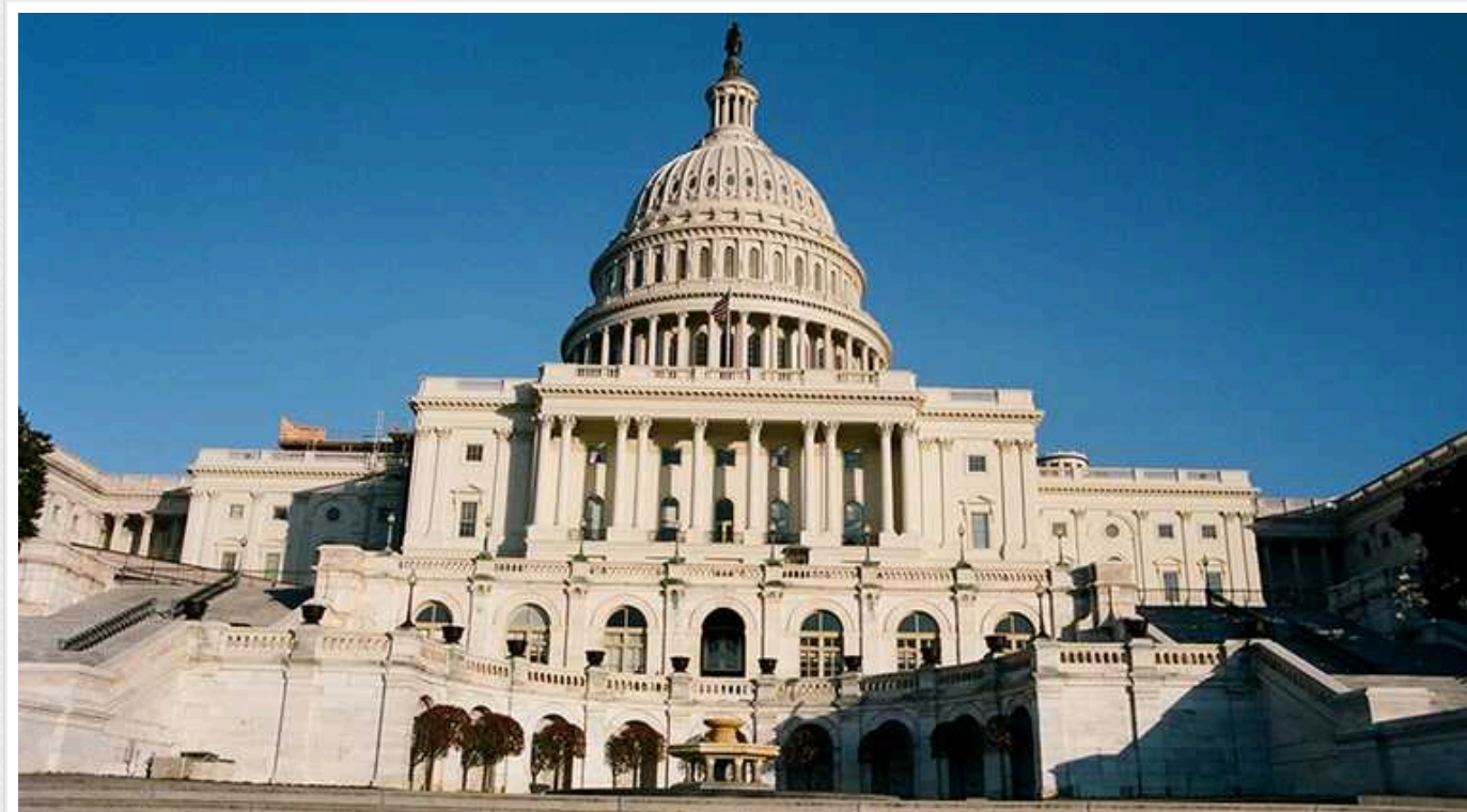
Bloomberg: Угода про допомогу Україні та кордону з Мексикою близька до провалу в Сенаті США

Двопартійна угода щодо запровадження нових обмежень на кордоні з Мексикою і розблокування військової допомоги Україні перебуває на межі зриву в Сенаті США, де підтримка республіканців впала перед обличчям протидії з боку кандидата в президенти Дональда Трампа.