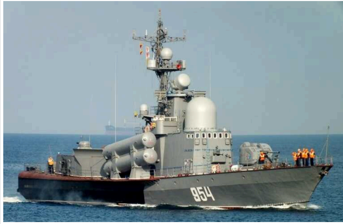
Розвідка Британії пояснила значення ліквідації ракетного катера "Ивановец"

Ліквідація російського ракетного катера "Ивановец" призведе до зниження можливостей Чорноморського флоту РФ, який, як і раніше, зберігає свою функціональність.