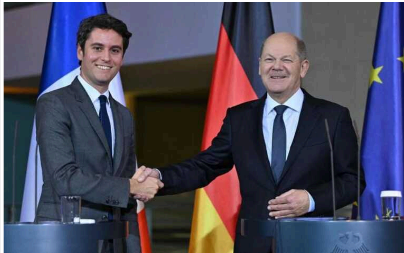
Канцлер Німеччини та прем'єр-міністр Франції пообіцяли подальшу військову підтримку Україні

Канцлер Німеччини Олаф Шольц та прем'єр-міністр Франції Габріель Атталь провели зустріч у Берліні, під час якої обговорили продовження військової підтримки України та посилення оборонної співпраці.