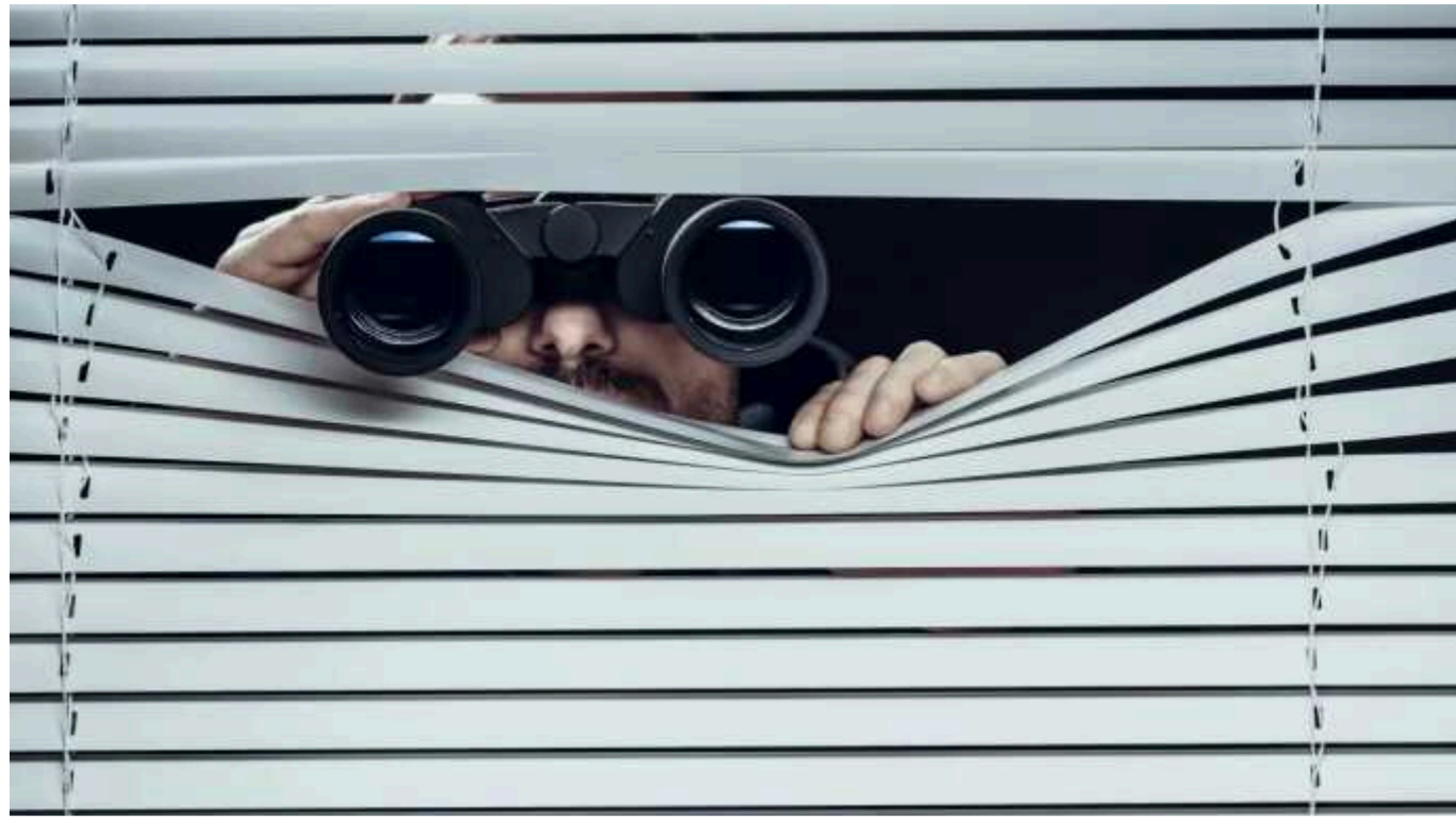
Журналісти Bihus.Info заявили, що стеження за ними продовжилося

Журналісти Bihus.Info продовжували фіксувати невідомих осіб, що стежили за ними, під час підготовки матеріалу про прослуховування команди працівниками Служби безпеки України.