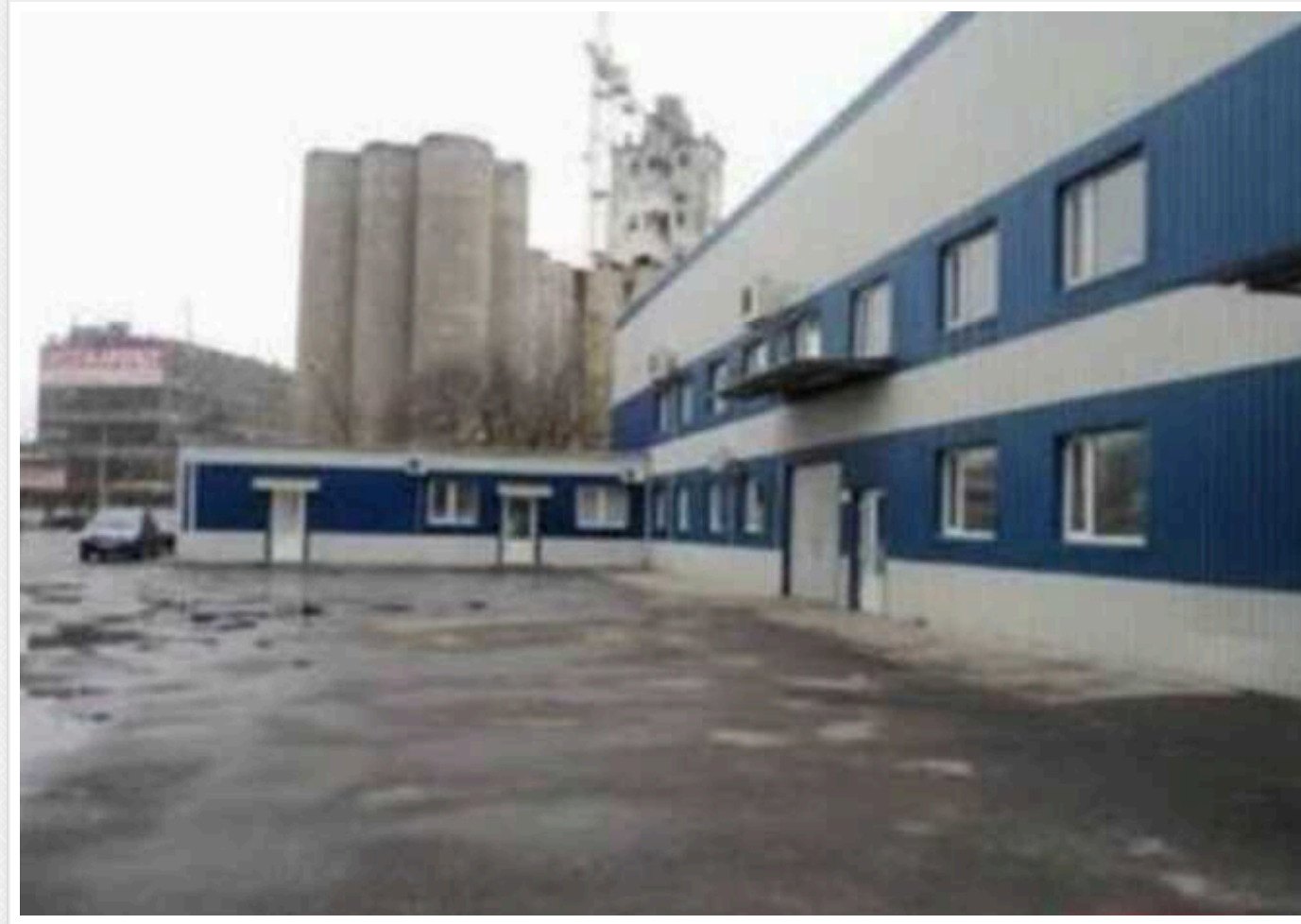
У Харкові АРМА передали арештоване майно російських бізнесменів