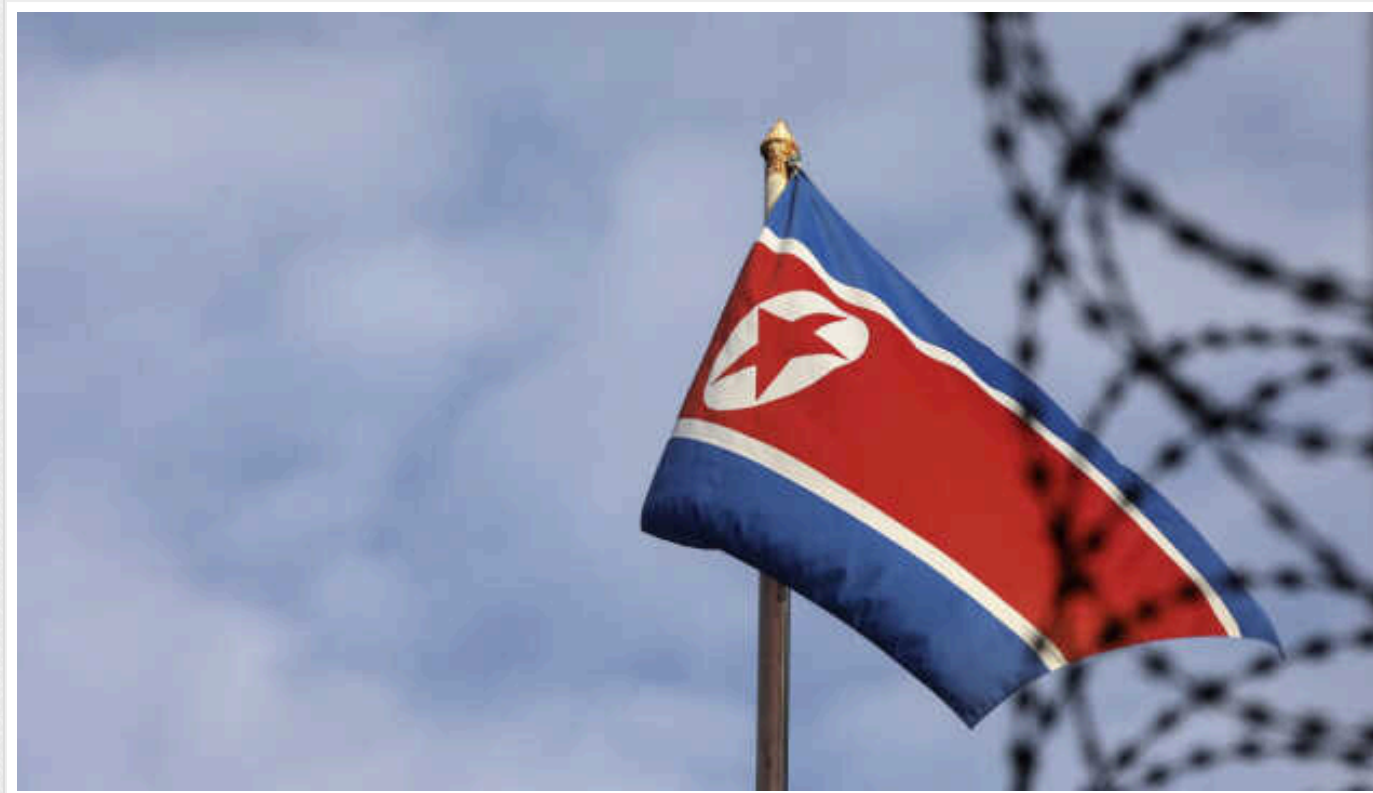
NYT: РФ розблокувала частину активів Північної Кореї в обмін на постачання зброї

Росія розблокувала частину активів Північної Кореї, заморожених через санкції ООН, в одному з російських банків, в обмін на зброю для війни проти України.