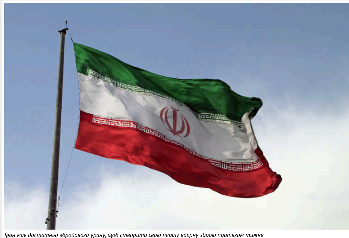
Іран має достатньо збройового урану, щоб створити свою першу ядерну зброю протягом тижня

Про це повідомляє американський Інститут науки та міжнародної безпеки.