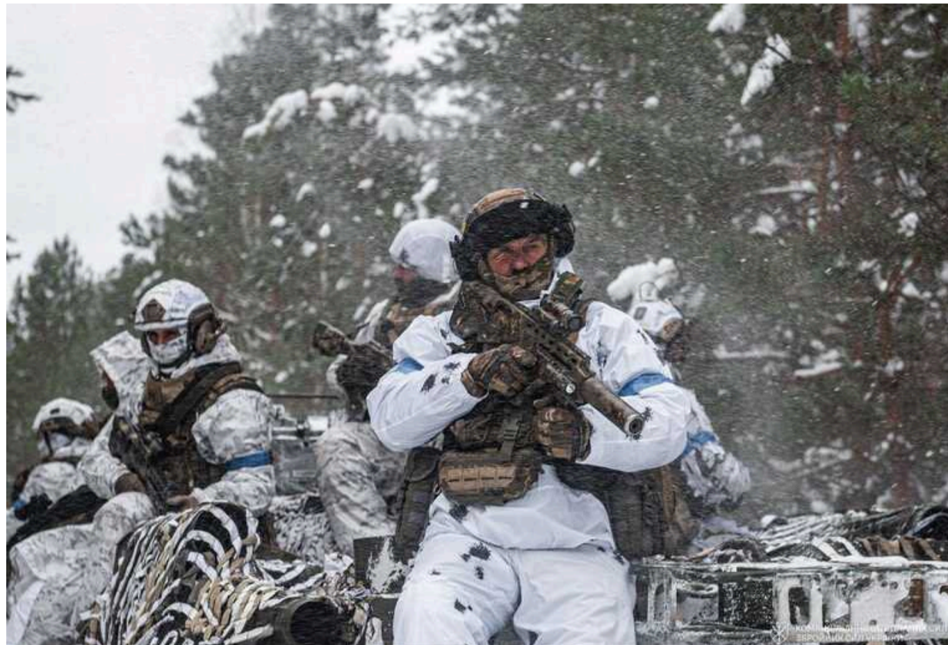
У тилу на кордоні Чернігівської та Сумської областей ДРГ ворога вбивають усіх, хто потрапляє в поле зору, використовуються FPV

Повідомляється, що русня таким чином тренуються на мирному населенні. Вони знищують вишки зв'язку, цивільні та військові автомобілі.