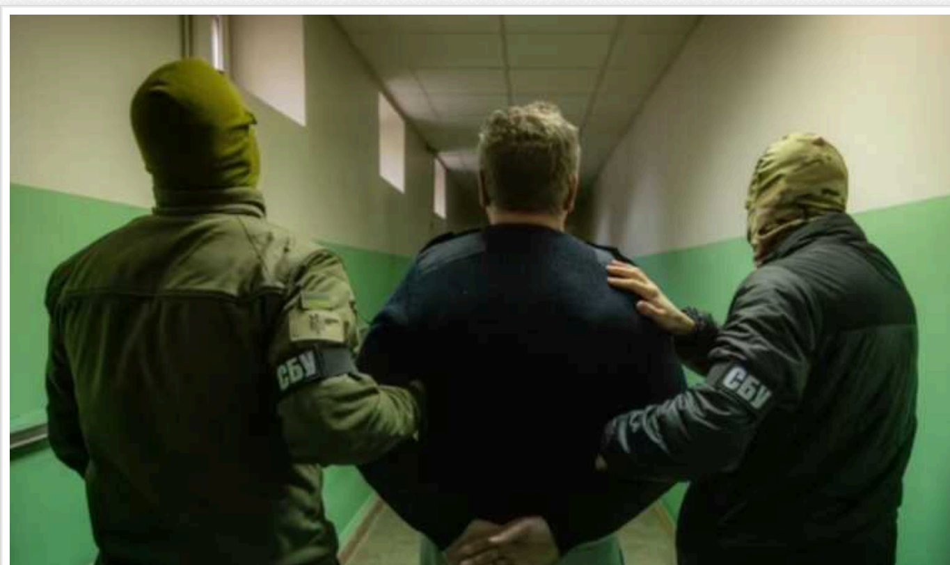
СБУ виявила серед співробітників спецслужб України російських шпигунів

Служба безпеки України знешкодила агентурну мережу російської ФСБ, до якої входили колишні та нинішні посадовці спецслужб України.