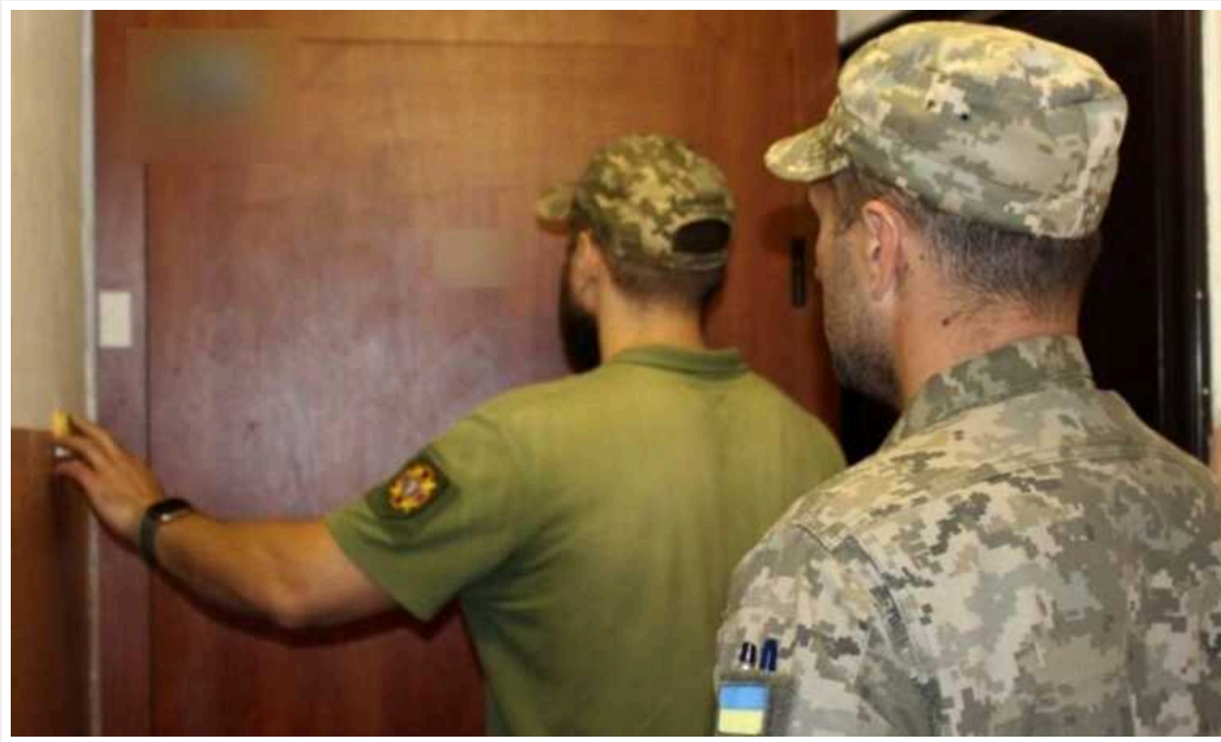
Мобілізація в Україні: українцям повторно вручать повістки