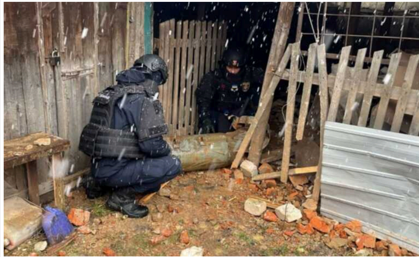
ISW: Україна змінює місця виробництва зброї, щоб захиститися від високоточних ударів