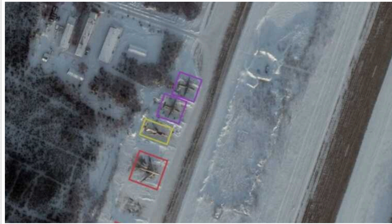
У Мережі опублікували супутникові знімки з аеродрому "Оленья"

Станом на 4 лютого, як інформують моніторингові канали, на аеродромі перебувало 50 одиниць авіаційної техніки, серед якої стратегічні бомбардувальники Ту-95МС та Ту-22М3.