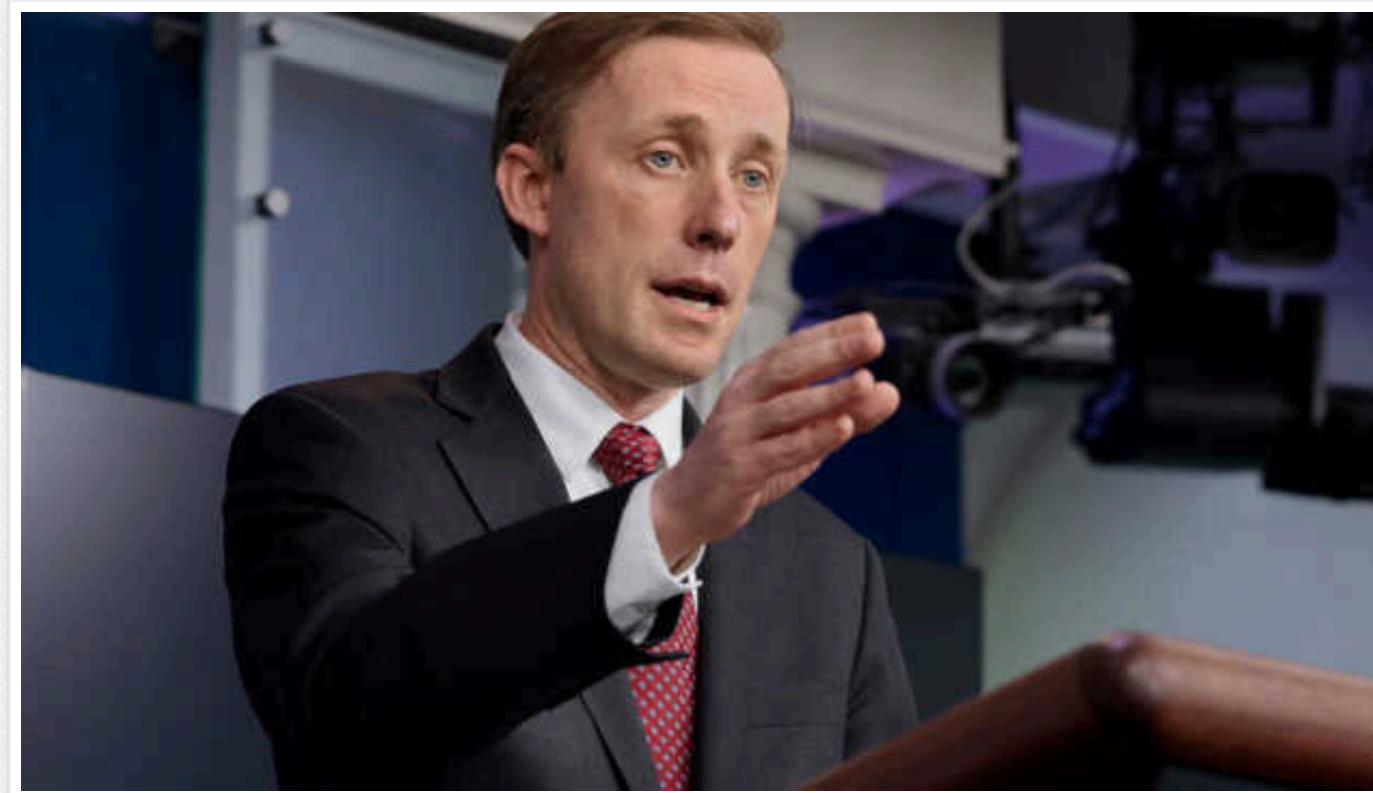
Президент США не затвердить фінансування Ізраїлю без України, – радник президента Салліван

Президент США Байден не затвердить фінансування Ізраїлю, ініційоване спікером Палати представників Майком Джонсоном, без включення у нього України.