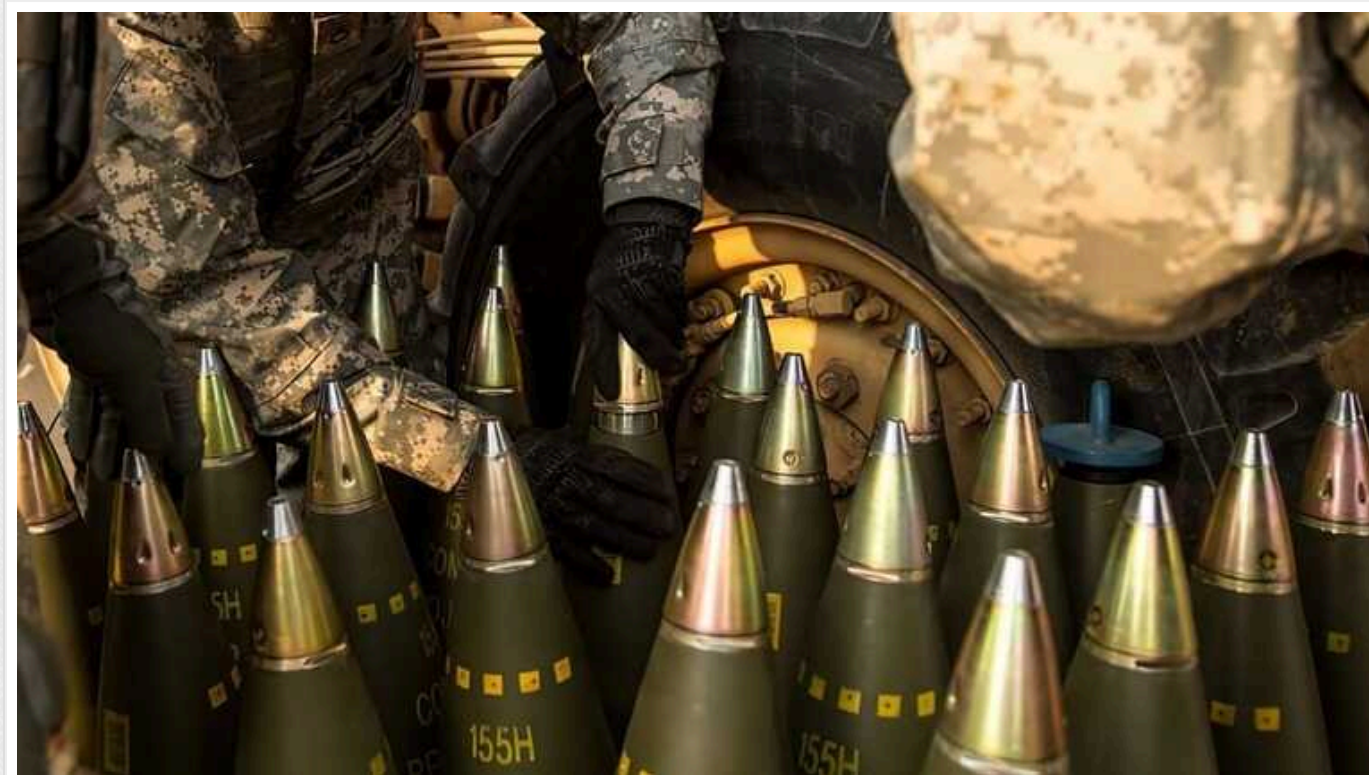
США до жовтня подвоять виробництво ключових боеприпасів, які використовуються Україною, – Дуг Буш

Начальник відділу закупівель армії Дуг Буш заявив, що США мають намір до жовтня подвоїти виробництво ключових боеприпасів, які використовуються Україною.