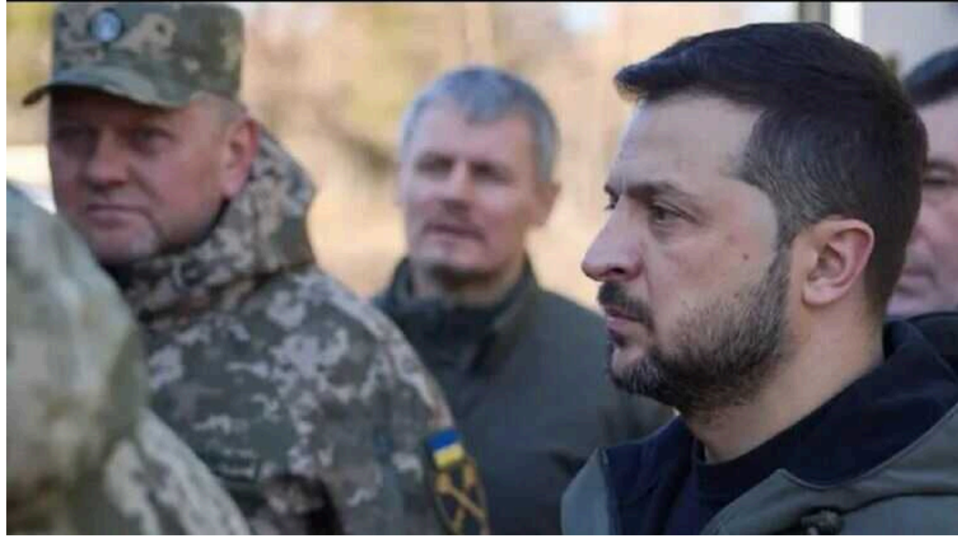
The Times: Зеленському потрібна нова команда, "яка думає, що ми можемо перемогти"

Президент Зеленський припустив, що він близький до звільнення надзвичайно популярного глави Збройних сил України в рамках радикальної зміни високопосадовців – крок, який, ймовірно, роздратує багатьох військових, пише видання.