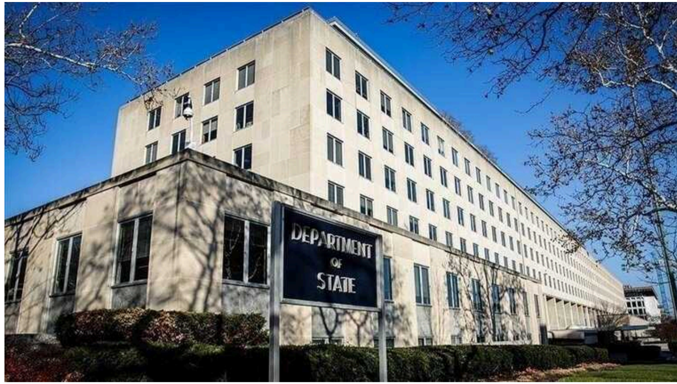
Держдеп США не довіряє заявам Кремля про збитий ІЛ-76 через негативну репутацію

США не довіряють інформації Кремля про збитий під Белгородом військово-транспортний літак ІЛ-76 через негативну репутацію Москви.