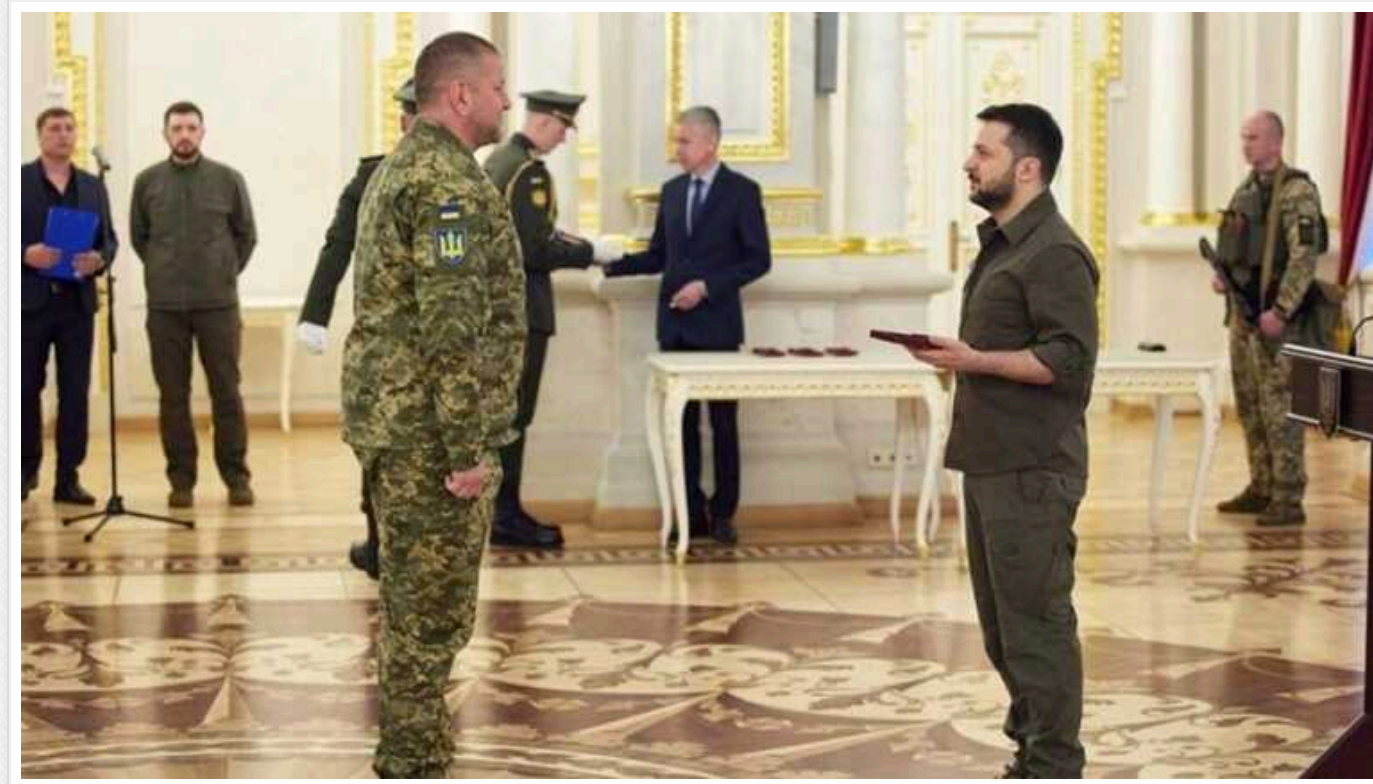
Times звинуватило Зеленського у спробі прибрати популярного конкурента та назвало Залужного "Залізним генералом"

Британське видання Times назвало Залужного "Залізним генералом" і звинуватило Зеленського у спробі прибрати популярнішого конкурента.