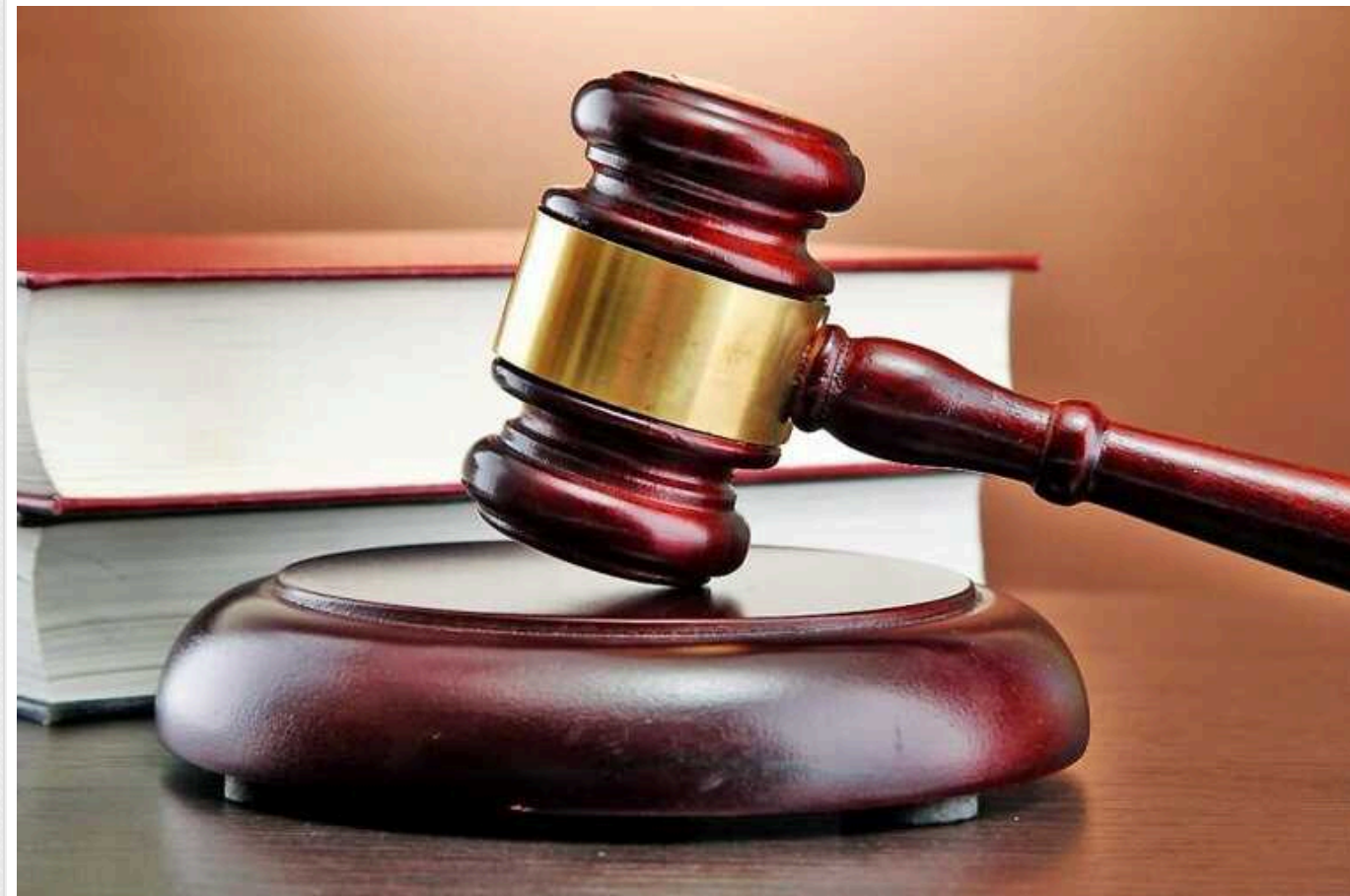
Працівника ТЦК на Львівщині покарав суд за копіювання інформації із закритих баз даних