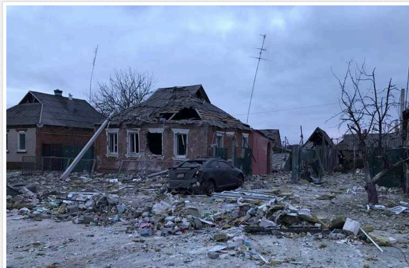
ЗС РФ били по Золочеву з С-300: загинув двомісячний хлопчик