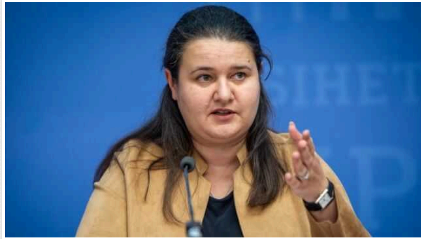
Найближчі три дні покажуть, чи проголосують у Сенаті США за нове фінансування допомоги Україні