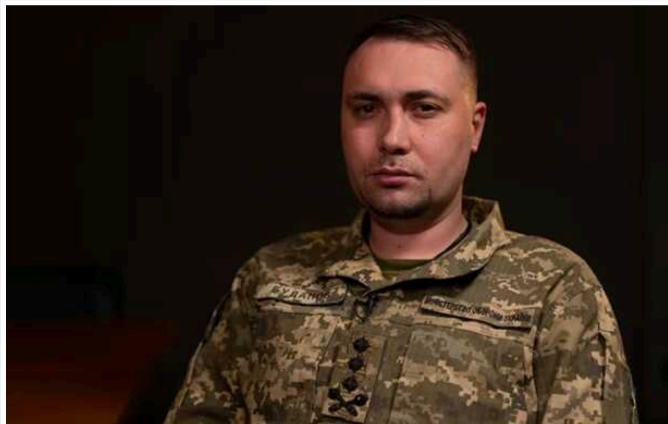
У ГУР закликали Канаду передати Україні ракети CRV7

Глава ГУР Кирило Буданов закликав Канаду передати Україні понад 80 тисяч ракет CRV7. Вони можуть бути утилізовані.