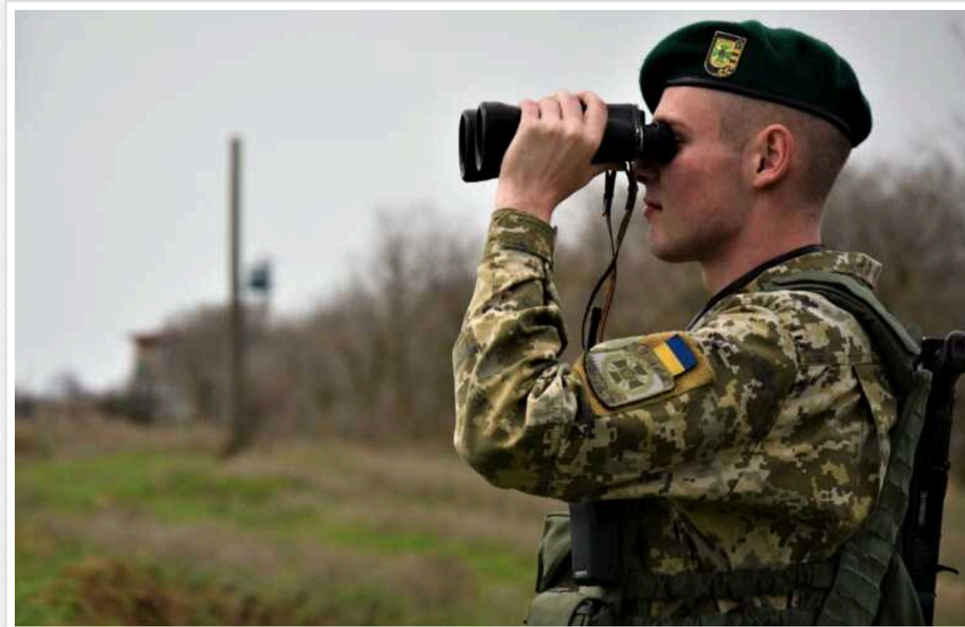
За кордон біжать не лише ухлянти, а і звичайні люди з відстрочкою, які мають роботу в Європі, бояться або мають кохання, – ЗМІ

У прикордонних зонах тепер є блокпости, де перевіряють абсолютно всіх, підозрілі та ті, хто не мають підстав для наближення до кордону, проходять перевірку.