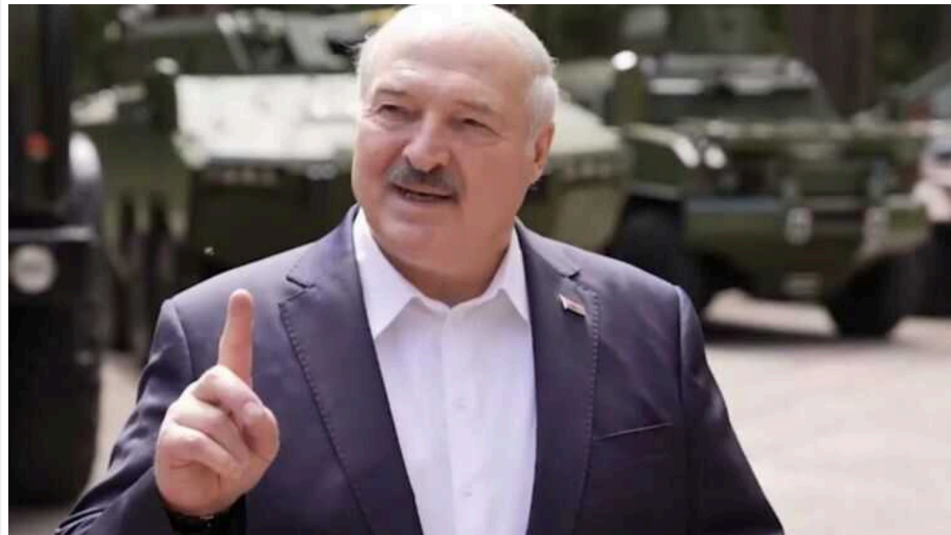
У Білорусі дозволили армії застосовувати зброю проти громадян країни