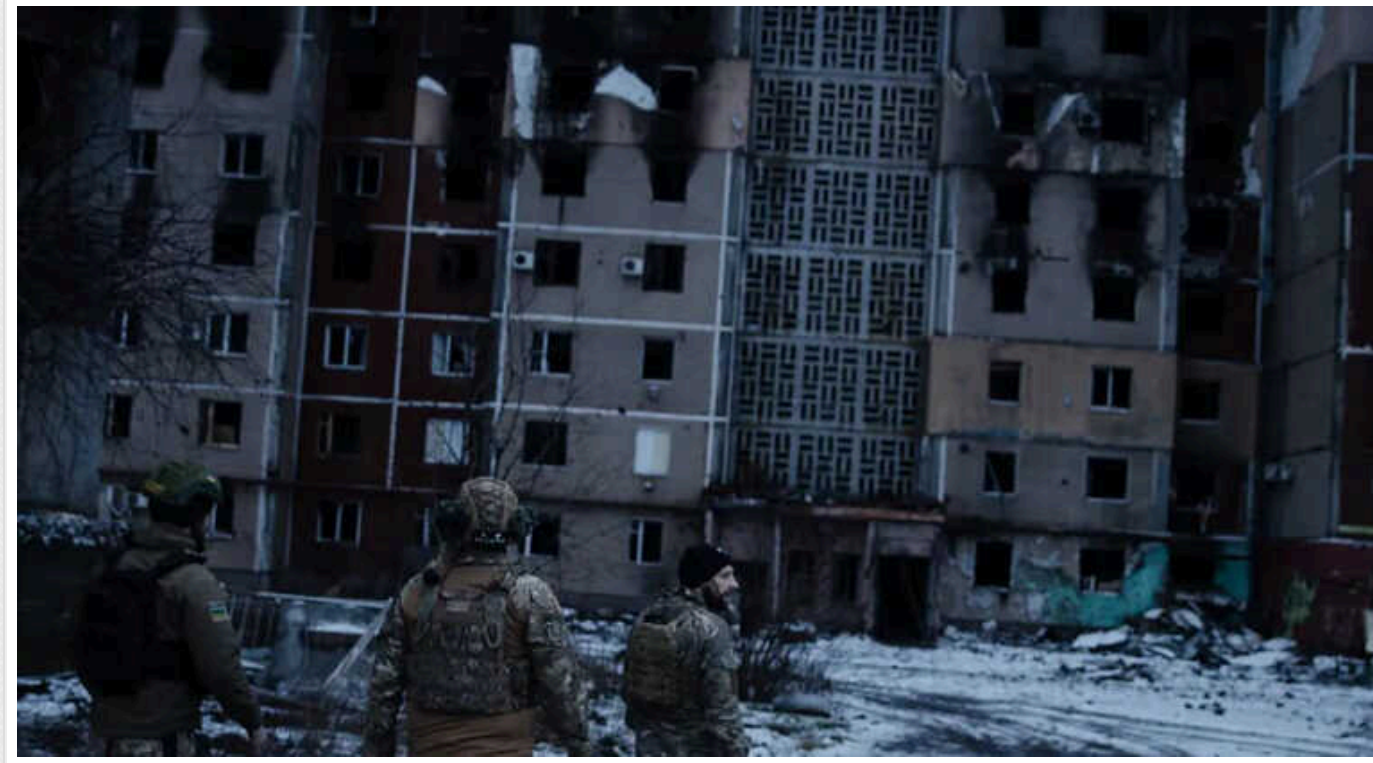
ЗСУ почали перекидати війська з частин у тилу, щоб укомплектувати поріділі піхотні підрозділи на фронті