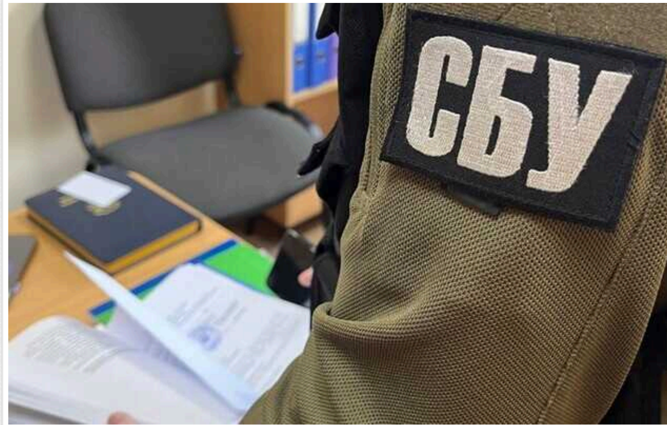
У СБУ звинуватили співробітників "Bihus.Info" в розповсюдженні наркотичних речовин

В пресслужбі СБУ заявили про причетність деяких співробітників "Bihus.Info" до розповсюдження наркотичних речовин.