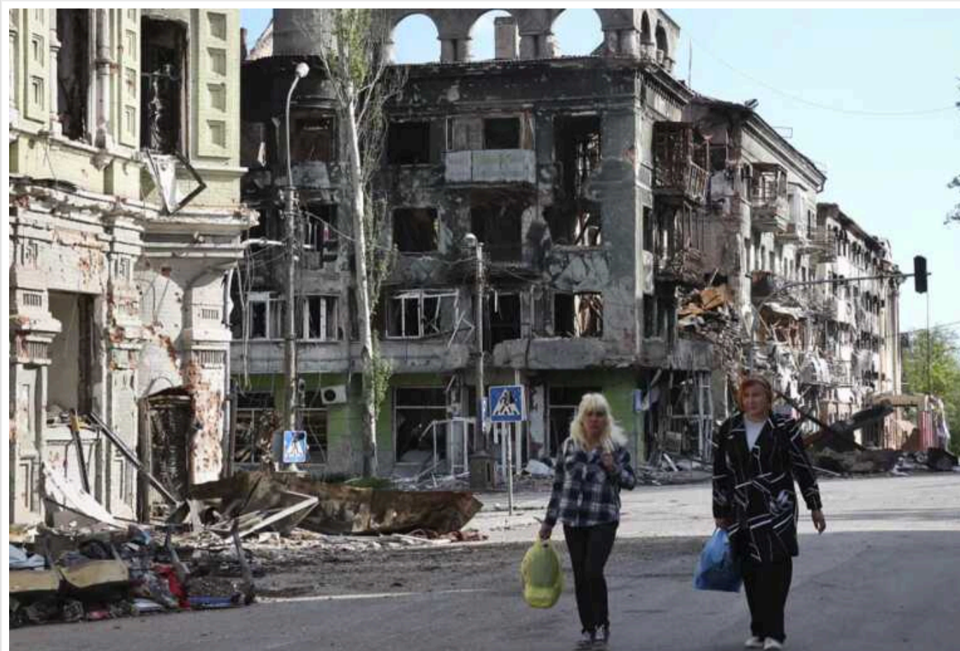
Маріупольці показали "якість" російських будівель: тріщини на стелях і стінах, іржаві труби, здуті підлоги і двері, що не зачиняються

Триповерхові новобудови на бульварі Шевченка в окупованому Маріуполі нарешті почали заселяти, розповідає ТГ-канал "Маріуполь Зараз".