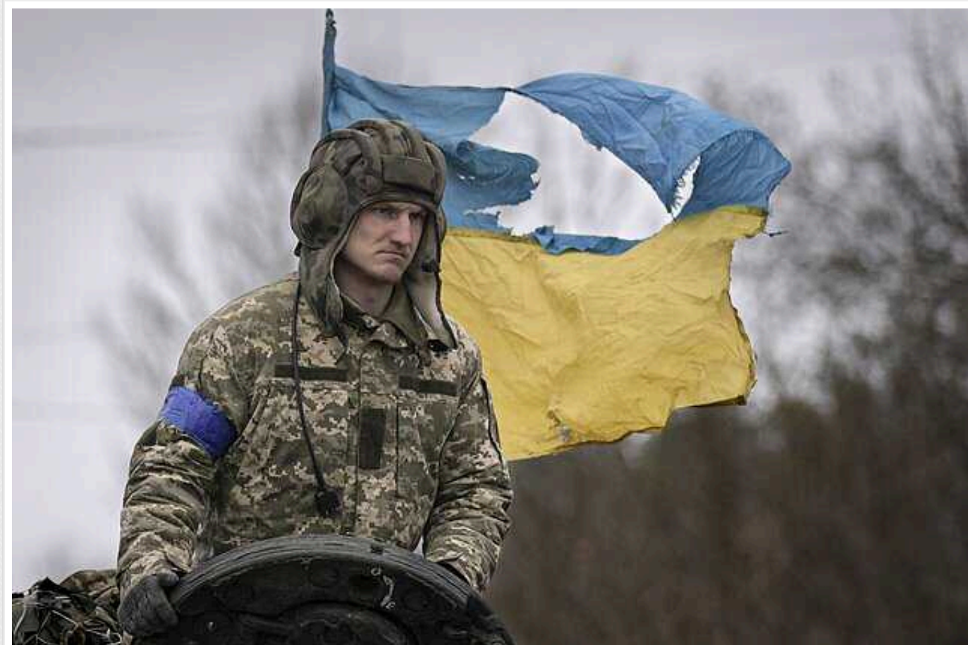
Цифровізація радянської системи: військовий розкритикував підходи до мобілізації та розповів, що треба робити

Заявлені владою нові підходи до мобілізації – це не більш як цифровізація застарілої радянської системи обліку та призову військовозобов'язаних. В оновленому законопроекті про мобілізацію відсутні важливі мотиваційні моменти, які можуть зробити військову службу усвідомленим вибором громадян, а не примусом.