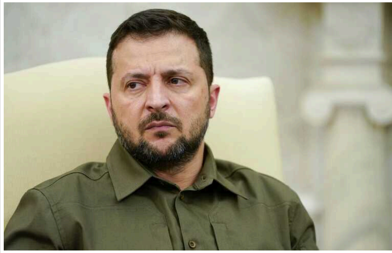
Зеленський у Кропивницькому обговорив нарощування РЕБ та посилення ППО

Президент України Володимир Зеленський провів оперативну нараду у Кропивницькому. Окремо обговорювалося питання захисту об'єктів критичної інфраструктури регіону від російських атак, посилення протиповітряної оборони та засобів радіоелектронної боротьби.