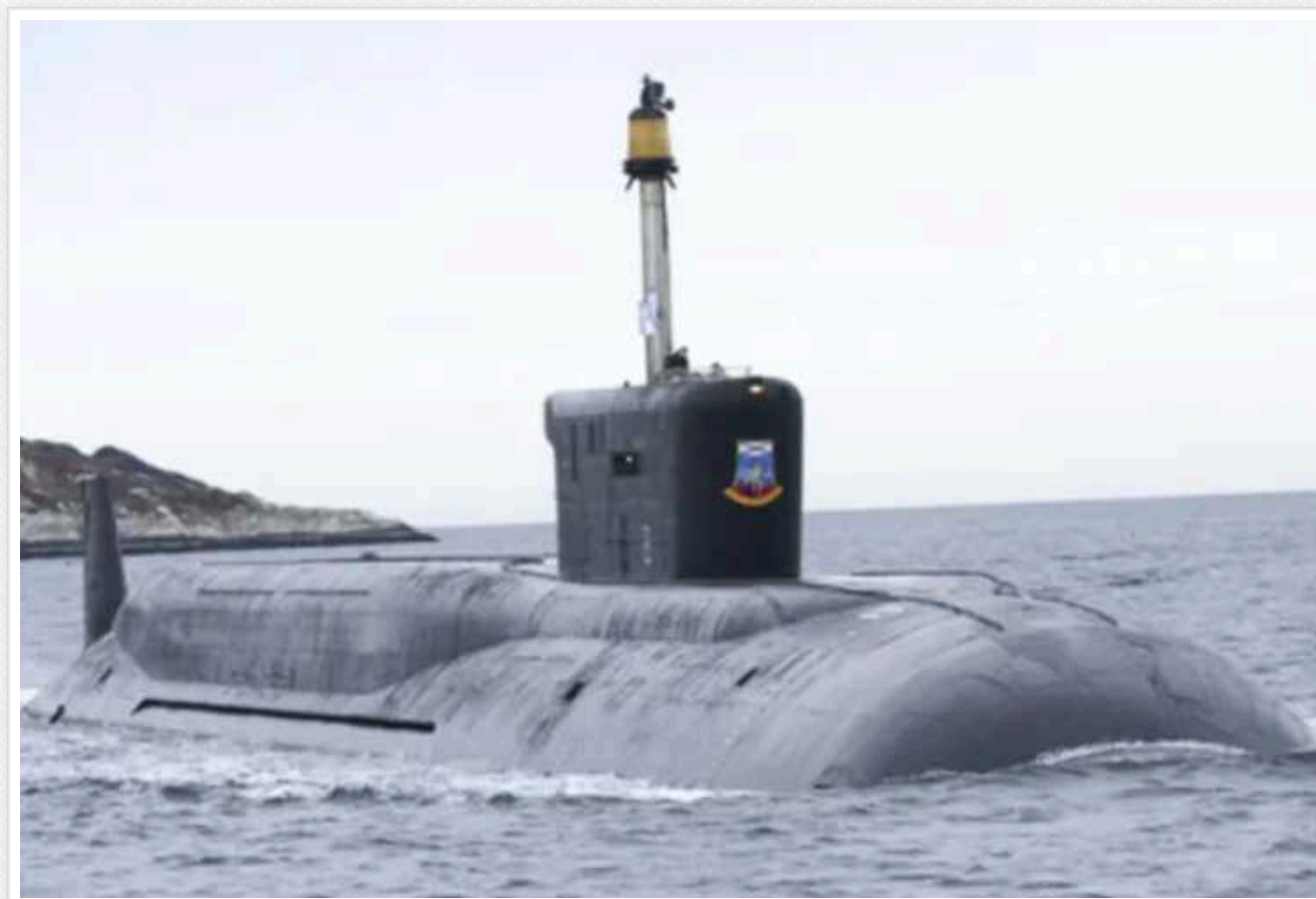
РФ вивела в Чорне море підводний човен: може бути озброєний чотирма крилатими ракетами "Калібр"

Вдень у понеділок, 5 лютого, війська Російської Федерації вивели на бойове чергування в Чорне море ракетносії. Йдеться про один підводний човен окупантів.