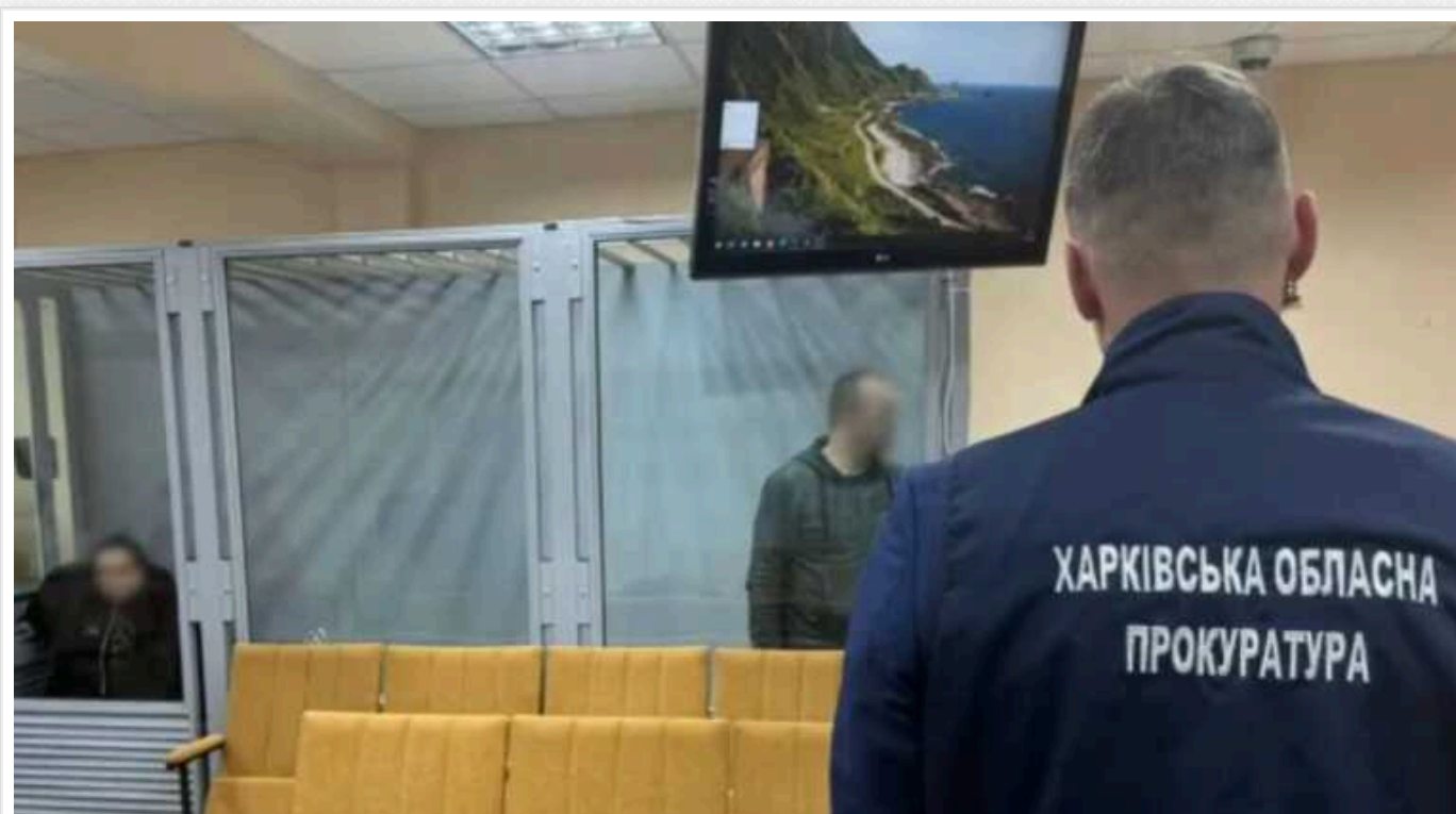
Двоє харків'ян отримали по 15 років позбавлення волі: "зливали" ворогу дані про дислокацію ЗСУ

Жінку та чоловіка, які "зливали" ворогу дані про дислокацію ЗСУ, засудили до 15 років позбавлення волі з конфіскацією майна. Харківський суд визнав їх винними у державній зраді, вчиненій за попередньою змовою групою осіб (ч. 2 ст. 28, ч. 2 ст. 111 КК України).