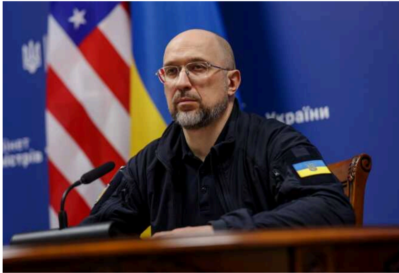
Зеленський разом із Залужним звільнить і Шмигалья, на посаду прем'єра є кандидат – Давидюк: "Усі будуть у шоці"

Президент Володимир Зеленський вперше прокоментував можливе звільнення головнокомандувача ЗСУ Валерія Залужного в інтерв'ю італійським медіа, заявивши, що Україні потрібна зміна керівництва – і не лише військового.