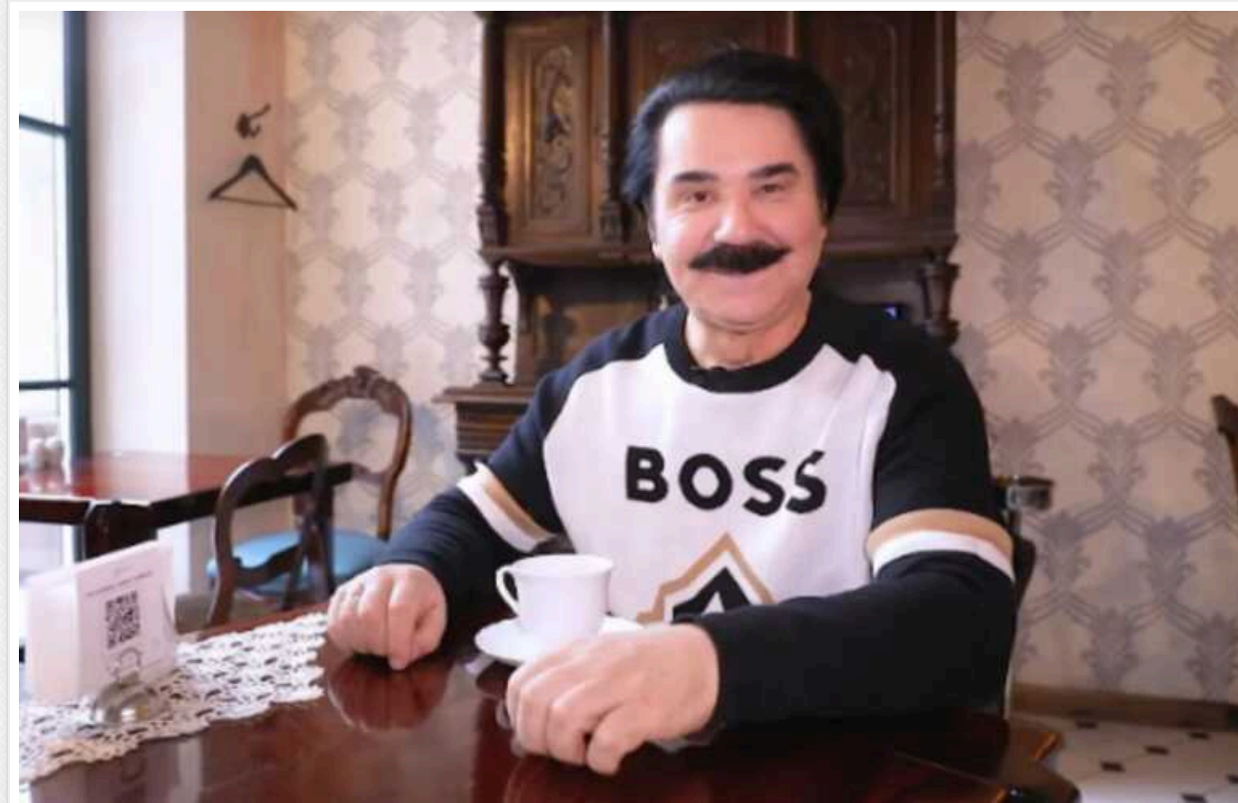
Павло Зібров розкрив розмір своєї пенсії та розповів про службу в Афганістані

Народний артист України Павло Зібров зізнався, що одержує 7500 гривень пенсії. Співак довгий час мріяв про п'ятизначні цифри на пенсійному рахунку через заслуги перед державою, але виявилось, що вони не підсумовуються – йдуть лише кошти за вислугу років та надбавка у 20%.