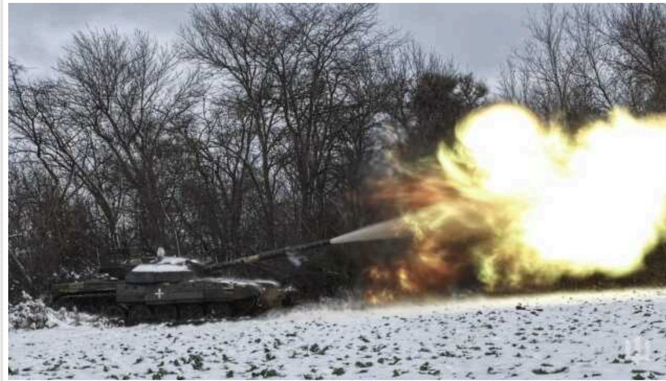
Ситуація на фронті: за добу на фронті відбулось 105 бойових зіткнень

За добу на фронті відбулося 105 бойових зіткнень між Силами оборони та російськими загарбниками, зокрема на Авдіївському напрямку відбито 38 атак.