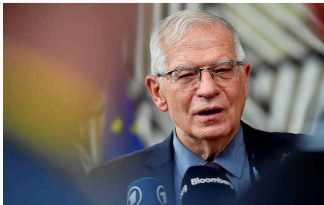
Боррель підтвердив, що після Польщі відвідає Україну

Високий представник ЄС Жозеп Боррель, який здійснив сьогодні візит до Польщі, підтвердив, що після Варшави прямує до Києва.