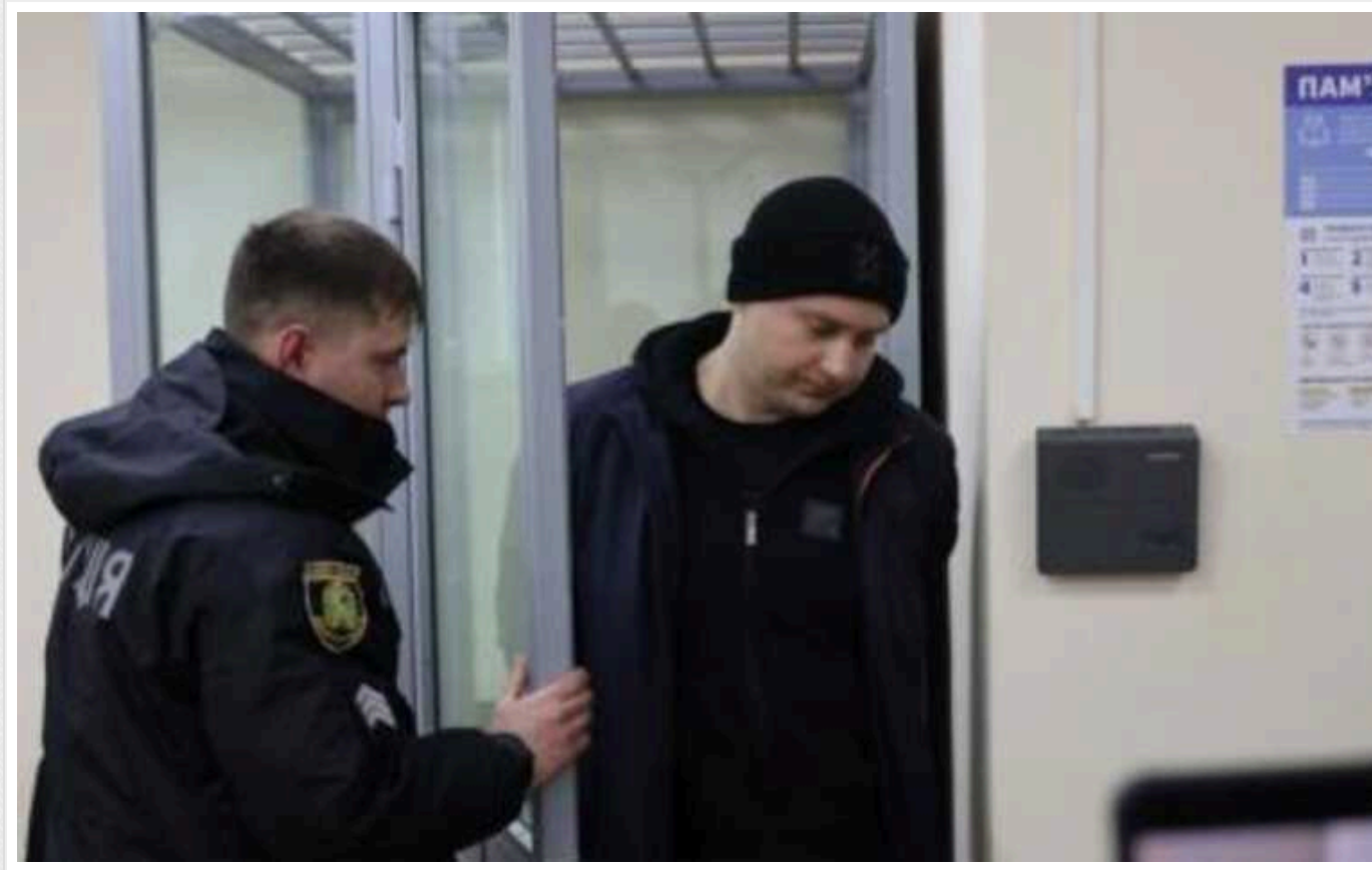
Зрадник з Ізюма втратив ступню на міні окупантів і отримав 15 років в'язниці

Олександра Солов'я також позбавили звання "старшого лейтенанта поліції".