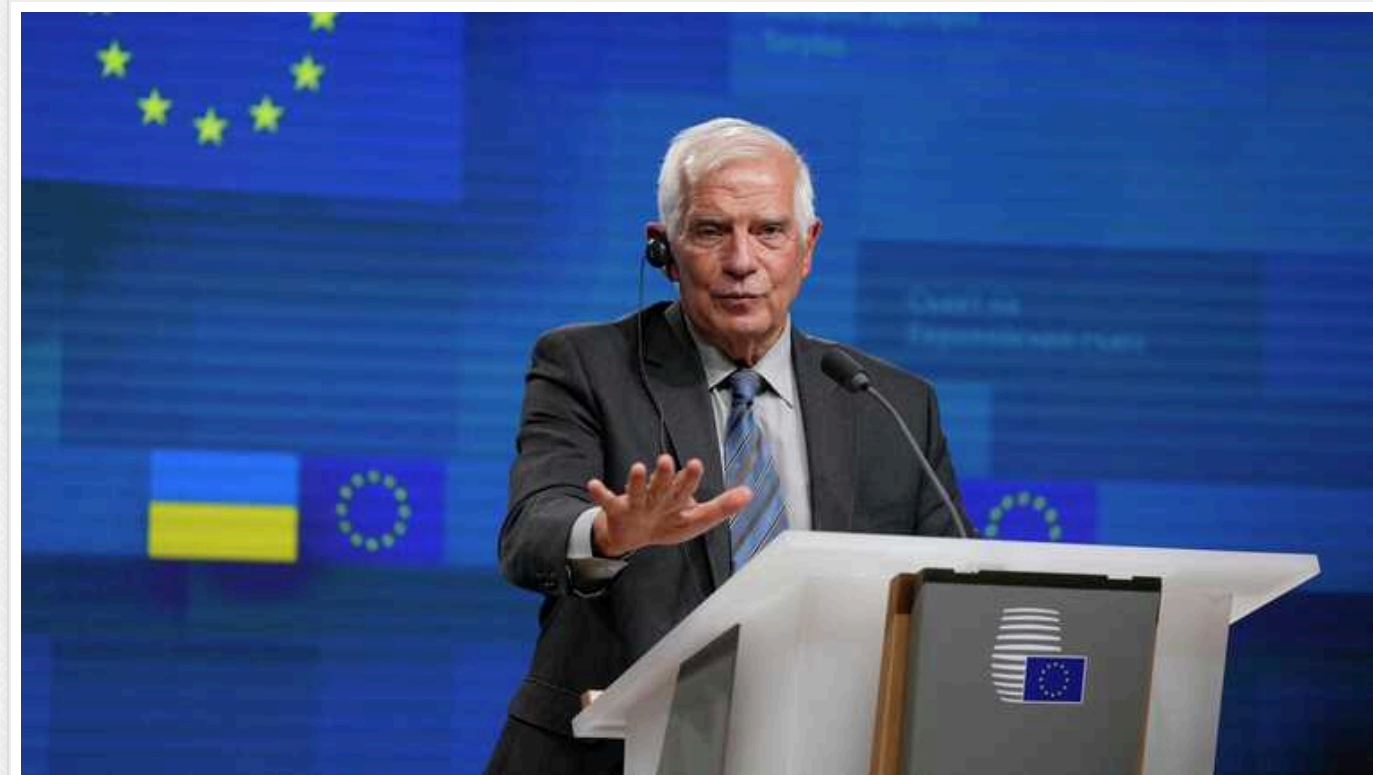
ЄС не виконує власні плани постачання Україні снарядів, тому що експортує їх до інших країн, - Боррель

Глава зовнішньополітичної служби Євросоюзу Жозеп Боррель заявив, що ЄС не виконує власних планів постачання Україні артилерійських снарядів не тому, що у країн ЄС не вистачає виробничих потужностей, а тому що вони експортують снаряди до інших країн.