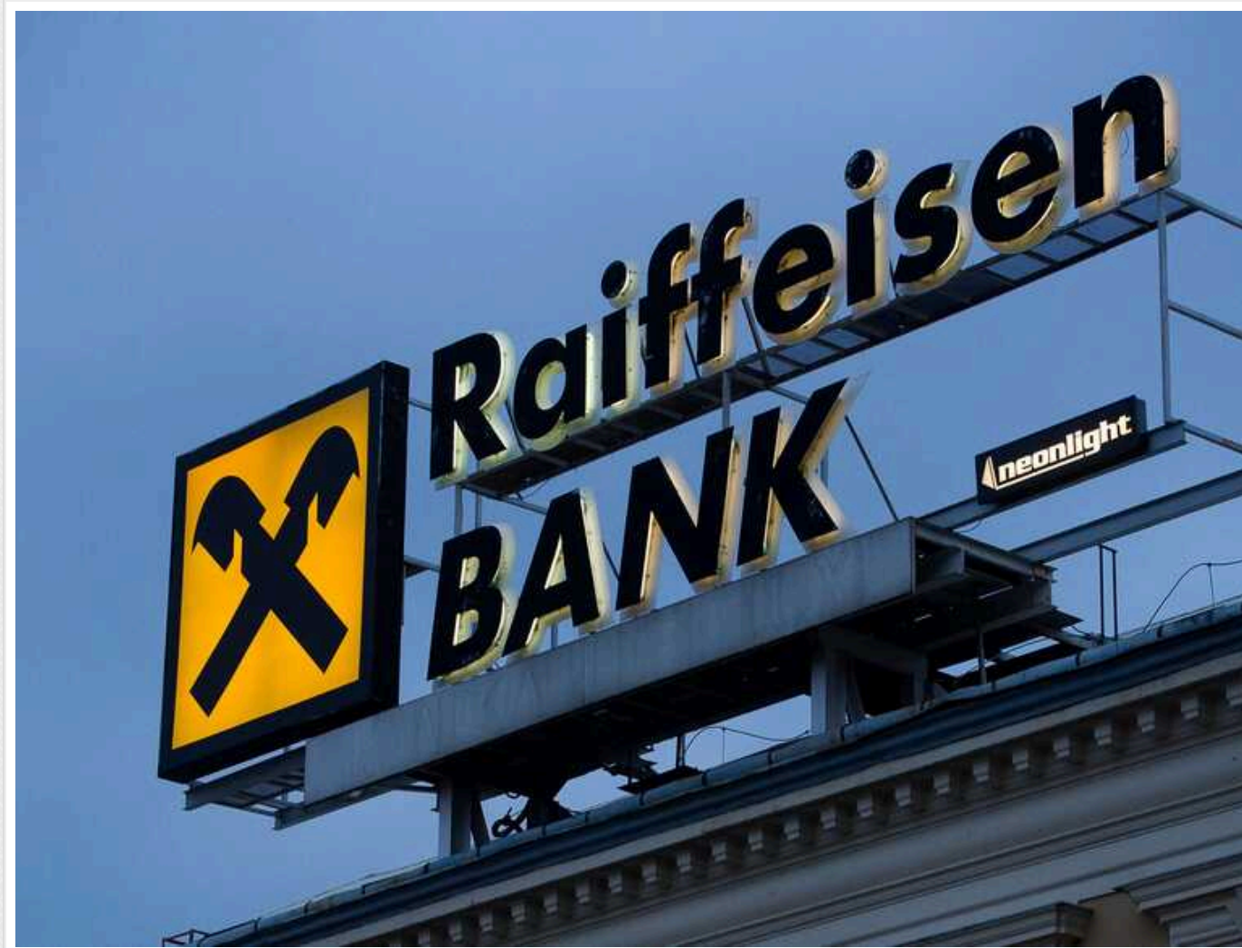
Raiffeisen Bank досі не прийняв однозначного рішення щодо виходу з РФ

Австрійська банківська група "Raiffeisen Bank International" (RBI) після двох років повномасштабної війни Росії проти України все ще продовжує розглядати вихід з російського ринку.