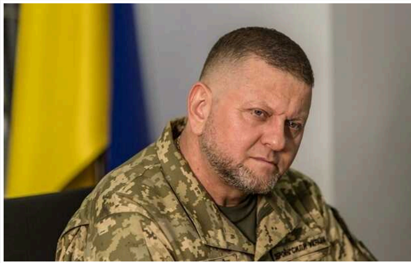
Вашингтон чинив тиск на Київ із метою усунення Залужного

Про це пише швейцарська газета Le Temps із посиланням на джерело в Мініборони України.