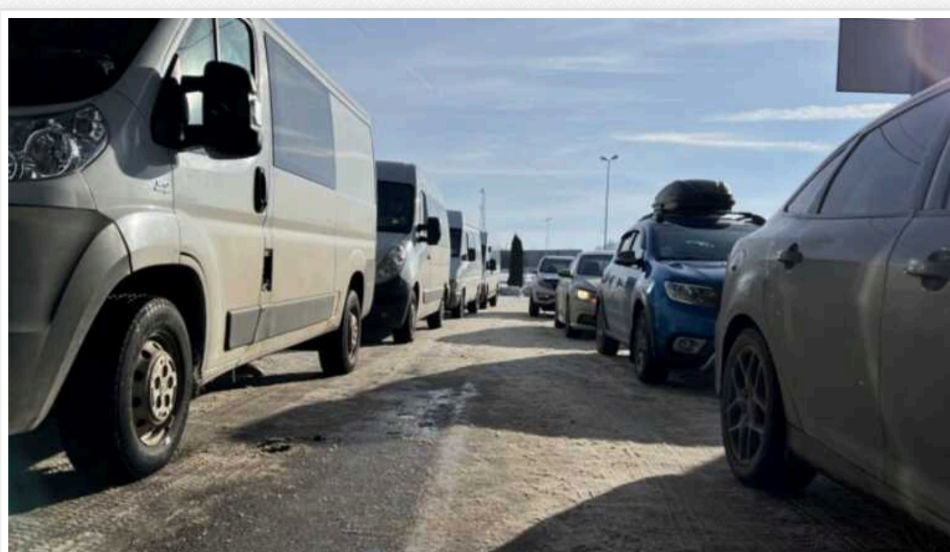
Блокпости ТЦК на кордоні: як діяти у разі затримання та вручення повісті

В Україні з'явилися блокпости ТЦК та СП біля кордону. Правоохоронні органи й територіальні центри комплектування та соціальної підтримки (колишні військомати) почли розгортати мобільні пости перед пунктами пропуску через державний кордон України.