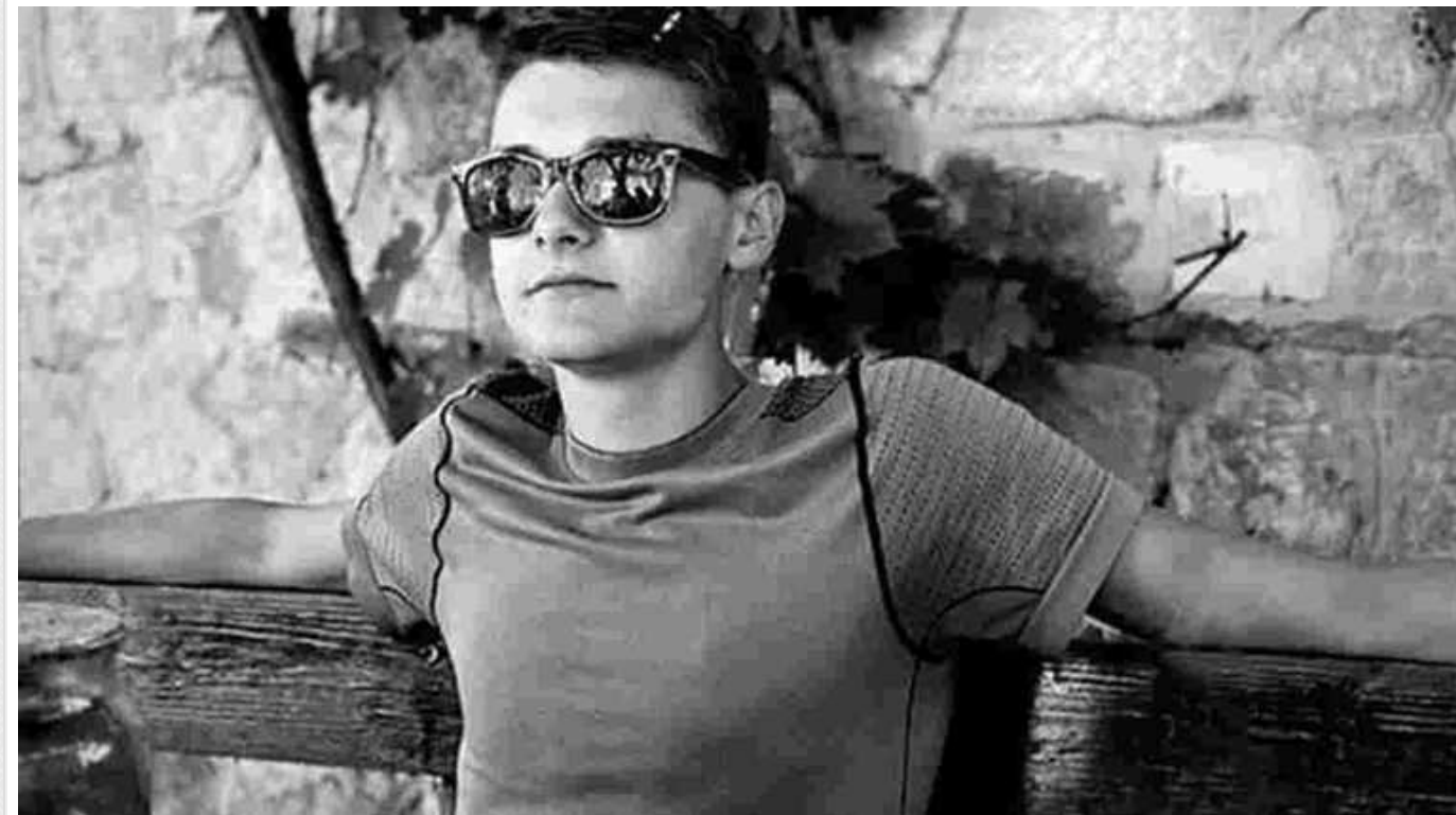
На Буковині від важких опіків у лікарні помер 19-річний хлопець

Односельчани вважають, що його вбили, а у поліції розглядають версію самогубства.