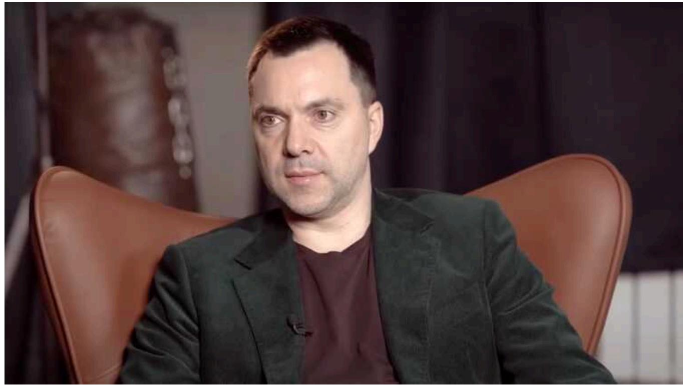
Арестович закликав українців розібратися з владою, а не вишукувати його каліфорнійські маєтки

Скандальний ексрадник Офісу президента вважає, що настав час поставити українській владі незручні питання для розв'язання реальних проблем, особливо в армії.