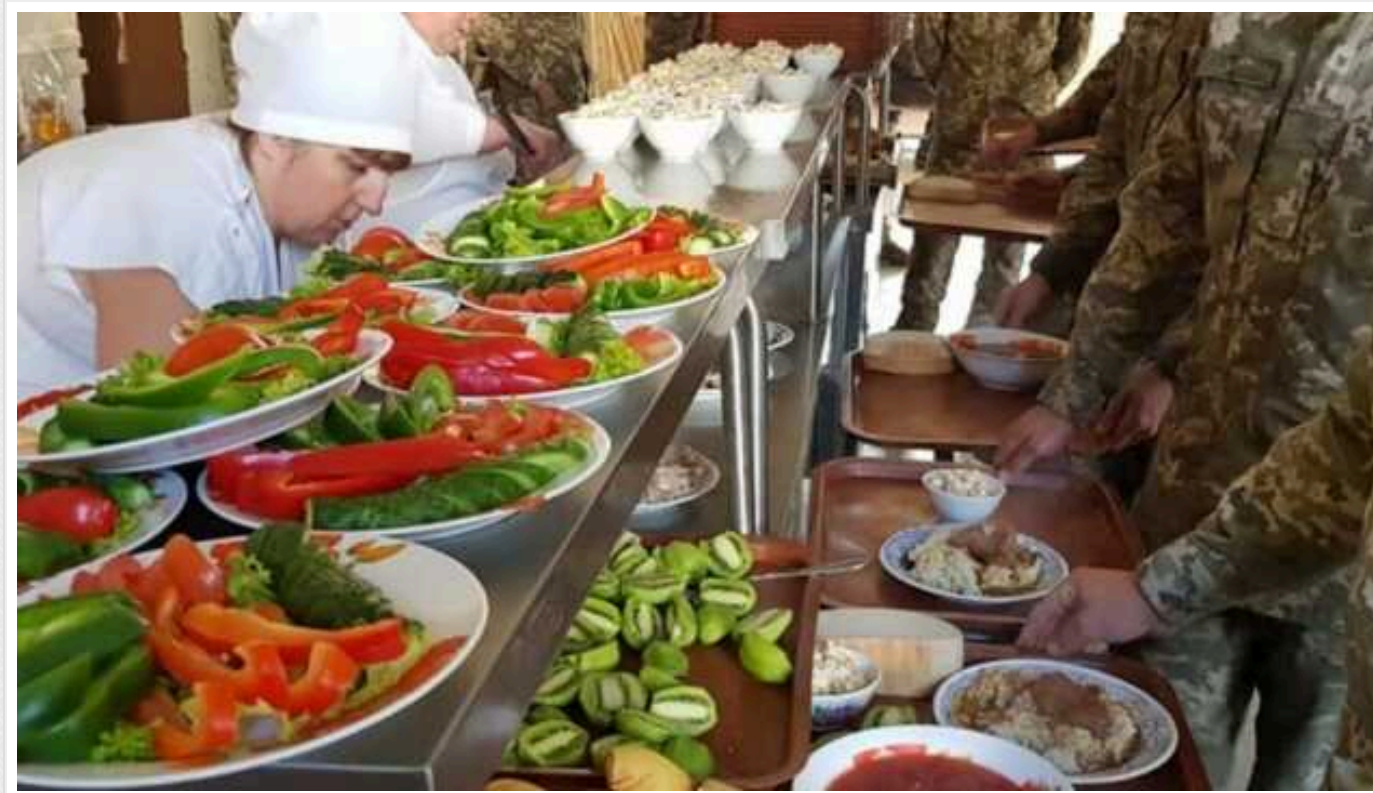
У Prozorro оголосили перші закупівлі харчів для Збройних сил за новою моделлю