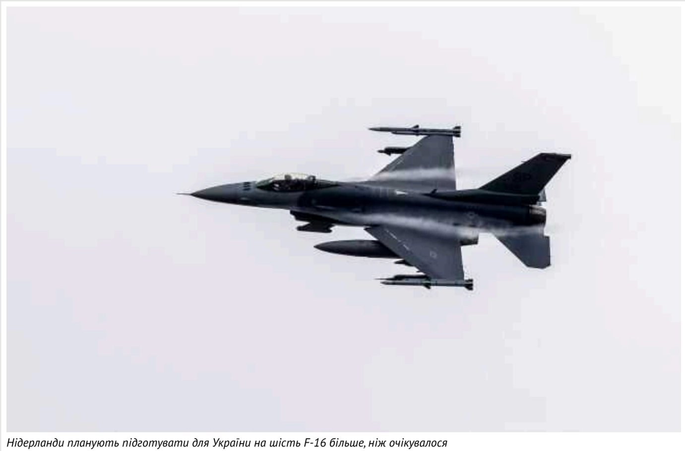
Нідерланди планують підготувати для України на шість F-16 більше, ніж очікувалося

Нідерланди планують підготувати для України ще шість додаткових винищувачів F-16. Загалом ЗСУ отримають 24 борти.