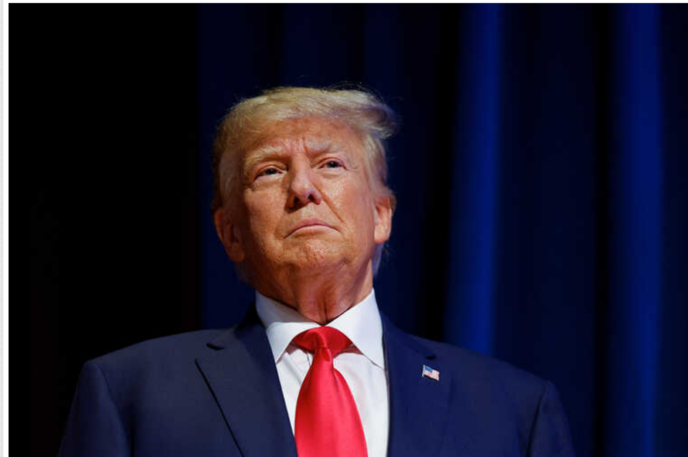
Financial Times: Виділення США допомоги Україні цього року "стає все менш ймовірним" очевидно через Трампа

Виділення американської допомоги Україні цього року "стає все менш ймовірним" через Трампа, пише журналіст Гідеон Рахман у Financial Times.