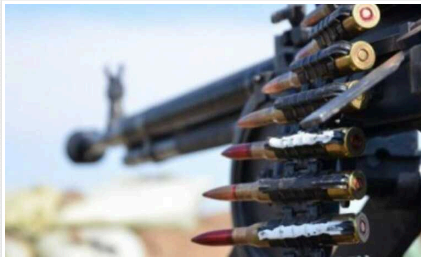
Окупанти готуються до прориву української оборони під Красногорівкою на Донеччині