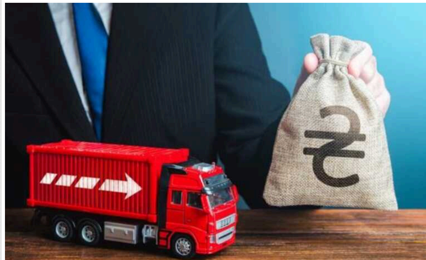
Про бізнес-терпіл України, суддівську мафію та податкове свавілля

Про те, як будувати та розвивати приватний бізнес в Україні, я знаю не з чуток... Понад 30 років тому, у розпал підприємництва, я кинув роботу на держпідприємстві і з величезним бажанням кинувся у приватний бізнес. Я знаю, я можу, я – факхівець, є чудовий колектив для роботи, перспективи величезні!